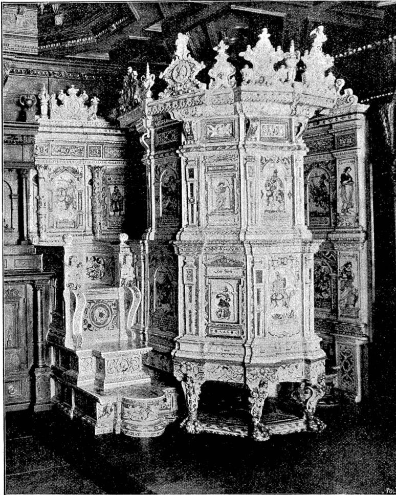
Schweizerisches Landesmuseum: Ofen aus dem Seidenhofkammer vom Jahre 1620. (Von Ludwig Pfau, Gafner in Winterthur).

oder Veräußerung ins Ausland geschützt werden sollten. Infolgedessen wurde H. Angst schon im Jahre 1886 auf den besonderen Wunsch des verstorbenen Bundesrates Schenk, damals Chef des Departements des Innern, in den Vorstand der Gesellschaft für Erhaltung historischer Kunstdenkmäler, die damals zur eidgenössischen Kommission für Erhaltung schweizerischer Altertümer erhoben wurde, gewählt, als deren Quästor er nicht nur die zahlreichen Geschäfte und Reisen im In- und Auslande besorgte,