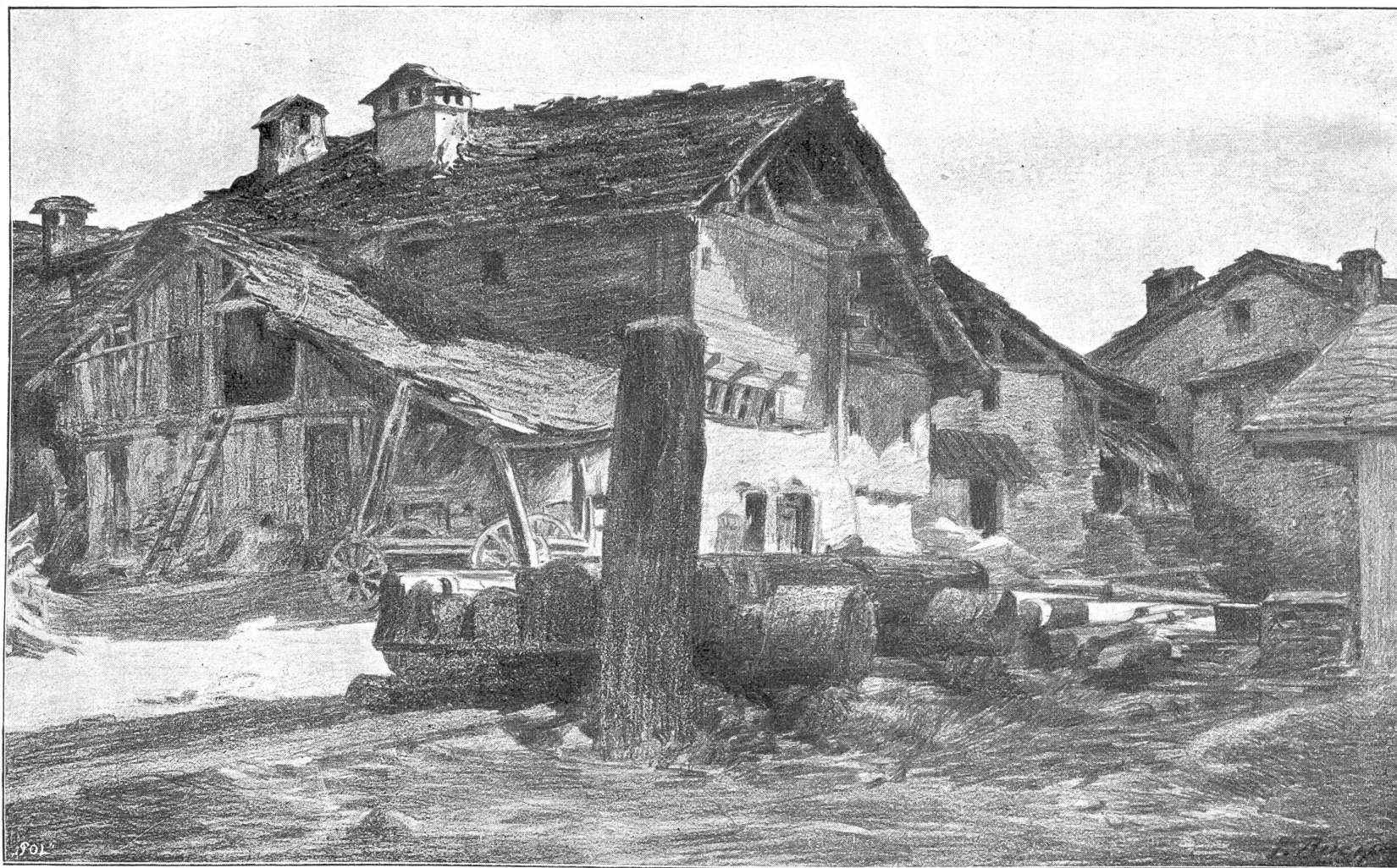
Studie aus dem Wallis. Von J. Ruch, Paris.