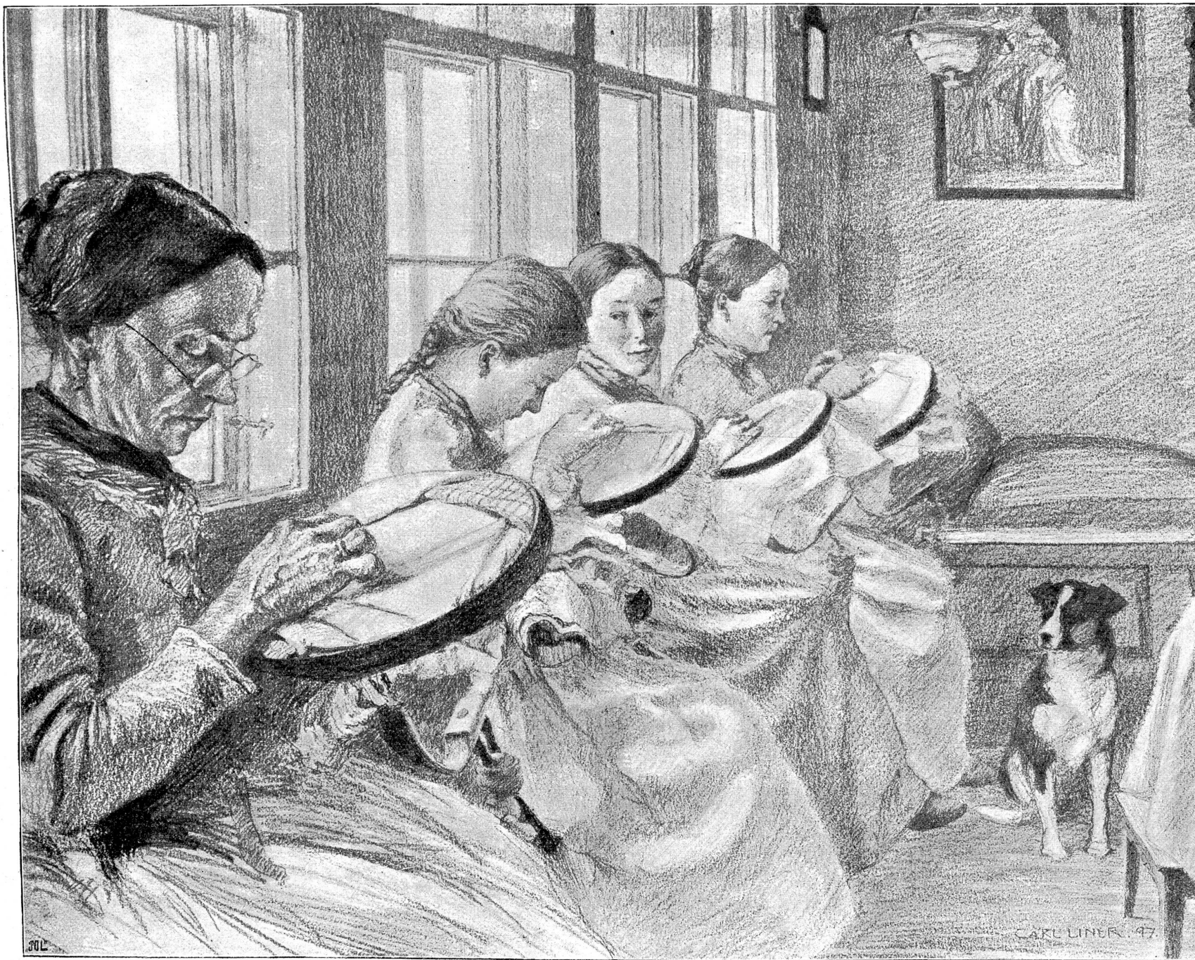
Appenzeller Stickerinnen. Originalzeichnung von Carl Liner, St. Gallen.