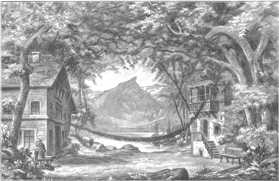
Das Nöski vom Säntis. Dekoration des I. Aktes: Am Seealpiee. Nach der ersten Aufführung am Stadttheater in Zürich gezeichnet von Herrn. Kultert, Zürich.