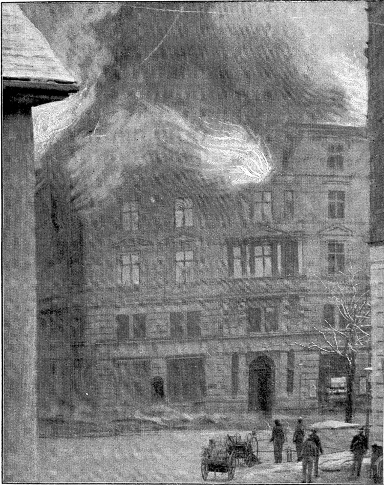
Die brennende Zentrale.

seits erforderte die in raschem Wachstum begriffene Zunahme der Telephon-Abonnenten ein fortwährendes Nachziehen von Drähten, die häufig in Bündeln von vielen Hunderten die Straßen überqueren. — Wenn auch, der Vorschrift entsprechend, an vielen Stellen, an denen die Telephondrähte hoch in der Luft das Tramkabel kreuzen, Sicherheitsnetze angebracht waren, um im Falle des Reißens eines Telephondrahtes dessen Anschluß an die Starkstromleitung zu verhindern, so war die Durchführung dieser nützlichen Maßregel doch nicht überall möglich. Das Unglück wollte es nun, daß infolge Ueberbelastung durch Schnee einer — oder