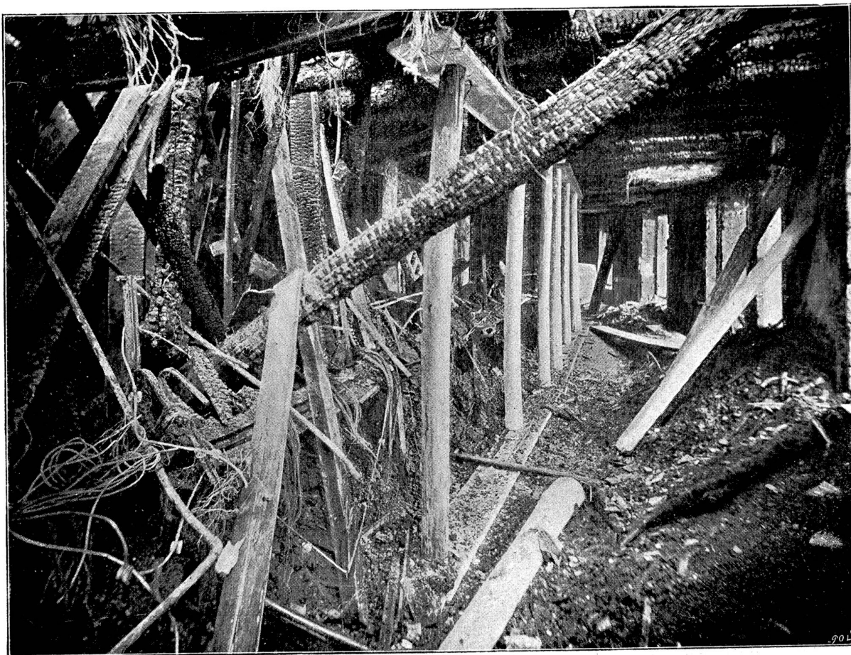
Der Multipel. Saal der Zürcher Telephon-Zentrale (Interne Station, 3. Stock).

mehrere — Telephondrähte gerade an einer solchen Stelle rissen, die noch nicht durch das Netz von dem darunter befindlichen Kabel geschützt war, und der enorm starke Strom nahm sofort seinen Weg nach der Telephon-Zentrale, die er auch im selben Momente in Brand setzte. Dies war um 9 Uhr 7 Minuten morgens.