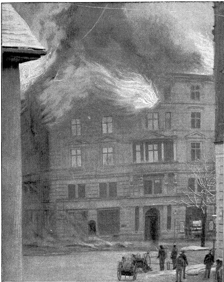
Die brennende Zentrale.

seits erforderte die in raschem Wachsen begriffene Zunahme der Telephon-Abonnenten ein fortwährendes Nachziehen von Drähten, die häufig in Bündeln von vielen Hunderten die Straßen überqueren. — Wenn auch, der Vorschrift entsprechend, an vielen Stellen, an denen die Telephondrähte hoch in der Luft das Tramkabel kreuzen, Sicherheitsnetze angebracht waren, um im Falle des Reißens eines Telephondrahtes dessen Anschluß an die Starkstromleitung zu verhindern, so war die Durchführung dieser nützlichen Maßregel doch nicht überall möglich. Das Unglück wollte es nun, daß infolge Überbelastung durch Schnee einer — oder