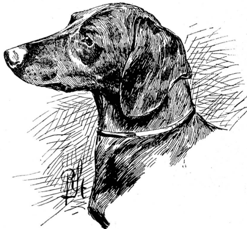
Dachshund. Zeichnung von Richard Strebel.

Die deutschen Vorstehhunde waren in stattlicher Anzahl aufmarschiert, und manch muskelkräftiger Bursche, dessen schlichtes, braunes Haarkleid deutliche Spuren harter Arbeit in Feld und Wald aufwies und dessen derber Körperbau darauf schließen ließ, daß der Hund nicht nur einen Hasen zu apportieren imstande sei, sondern nötigenfalls auch mit Meister Reinecke fertig würde, betrat würdevollen Schrittes den Preisring. Die schönste Kollektion hatte hier Herr Forstmeister Neukomm von Schaffhausen ausgestellt und nach unserer unmaßgeblichen Meinung mehr Beachtung verdient, als ihm von seiten des Richters zu teil wurde. — Ein Paar dreifarbige, württembergische Vorstehhunde von sogenanntem alideutschem Typus konnte mit I. und II. Preis bedacht werden, und die gleiche Auszeichnung wurde einem Paar langhaariger, deutscher Vorsteh-