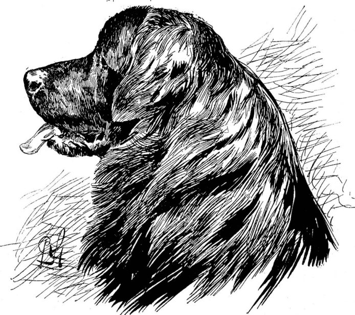
Neufundländer. Zeichnung von Richard Strebel.

So wenig die vorhandenen Spitzer einer Erwähnung wert waren, so gut waren die deutschen, rauhhaarigen Pinscher, vulgo Schnauzer, vertreten, unter denen mancher stramme Bursche mit prächtigem, typischem Kopfe zu notieren war. Unter den Schoßhunden oder Damenhunden brillierte die reich-