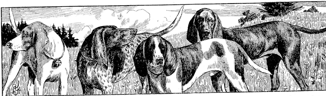
Schweizer Laufhunde. Zeichnung von Richard Strebel.