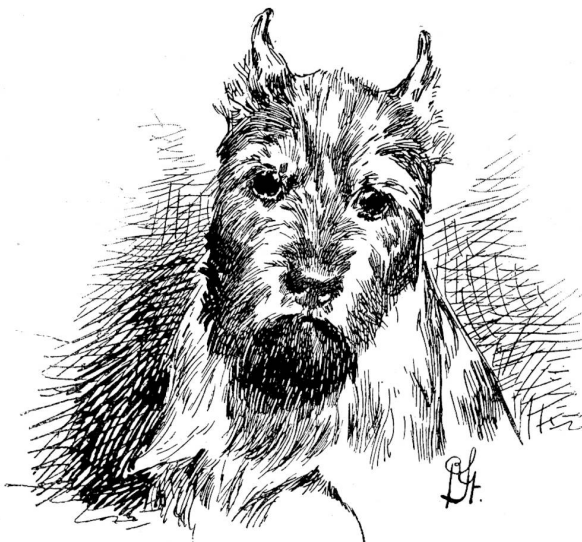
Schnauzer. Zeichnung von Richard Strebel.

Eine nicht minder schöne, wenn auch in der Schweiz unverhältnismäßig weit weniger populäre Hunderrasse ist die deutsche Dogge, die stets nur in wenigen, leider meist noch recht schlechten Exemplaren vertreten zu sein pflegt. Wenn auch hier wieder an Zahl gering, so doch an Qualität hervorragend waren na-