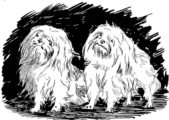
Schöpfhündchen (Seidenpinscher). Zeichnung von Richard Strebel.

Wie an jeder schweizerischen Hundeausstellung nahm auch hier der seit Jahrzehnten über die ganze, zivilisierte Welt verbreitete, mit dem frommen Nimbus einer altehrwürdigen Tradition umgebene, schweizerische Nationalhund, der Bernhardiner, das größte Interesse in Anspruch. Wenn auch die mit den höchsten Ehren ausgezeichneten Vertreter dieser Rasse den Kennern und Liebhabern dieser Tiere alte Bekannte waren, so erregten sie bei dem Laienpublikum doch große Bewunderung, und die Preisringe, wo die Richter ihres