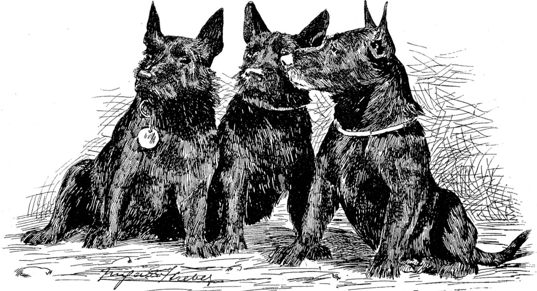
Scotch-Terriers. Zeichnung von Richard Strebel.

Neu waren auch einige ungarische und russische Schäferhunde mit langzottiger Behaarung von fahlgelber und schwarzgrauer Farbe, die mit dem Aussehen von Griffons die Größe von Bernhardinern verbanden und unter ihren kuschigen Brauen hervor aus gar treu-