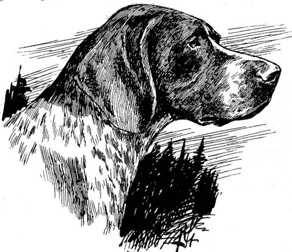
Kopf eines St. Bernhard. Zeichnung von Richard Strebel.

Das Interesse aller anwesenden Kynologen beanspruchten die sonst wohl noch kaum jemals ausgestellten Abruzzenhunde sowohl als die Appenzeller Sennenhunde. Die erstere Art bildet eine Varietät der in allen europäischen Mittelmeerländern verbreiteten Rasse von Hirtenhunden, die im Gegensatz zu den Schäferhunden, welche ihre Schützlinge zu führen und zu dirigieren haben, nur dazu dienen, die Herden gegen die Angriffe der Raubtiere zu schützen und daher überall dort am Platze sind, wo die Herden das ganze Jahr auf ihren Weideplätzen unter freiem Himmel verbleiben. Es sind gelblichweiße, wollhaarige Hunde von der Größe des deutschen Schäferhundes mit halbgestellten Ohren und fröhlich nach oben gekrümmter Rute, — also nicht gerade das, was man gemeiniglich unter einem schönen Hunde zu verstehen pflegt. Ebenjowenig Anspruch auf Schönheit können die Appenzeller Sennenhunde machen. Dies sind annähernd ebenso große, kurzhaarige Tiere von schwarzweißer Farbe, d. h. mit schwarzem Mantel auf weißem Grunde, weißer Blässe, dito Läufen und Ruten- spitze, und gelben Flecken über den Augen, sowie an den Extremitäten. So sehr wir auch dem verehrlichen Ausstellungs Komitee zu Dank dafür verpflichtet sind, daß es dem großen Publikum Gelegenheit gegeben hat,