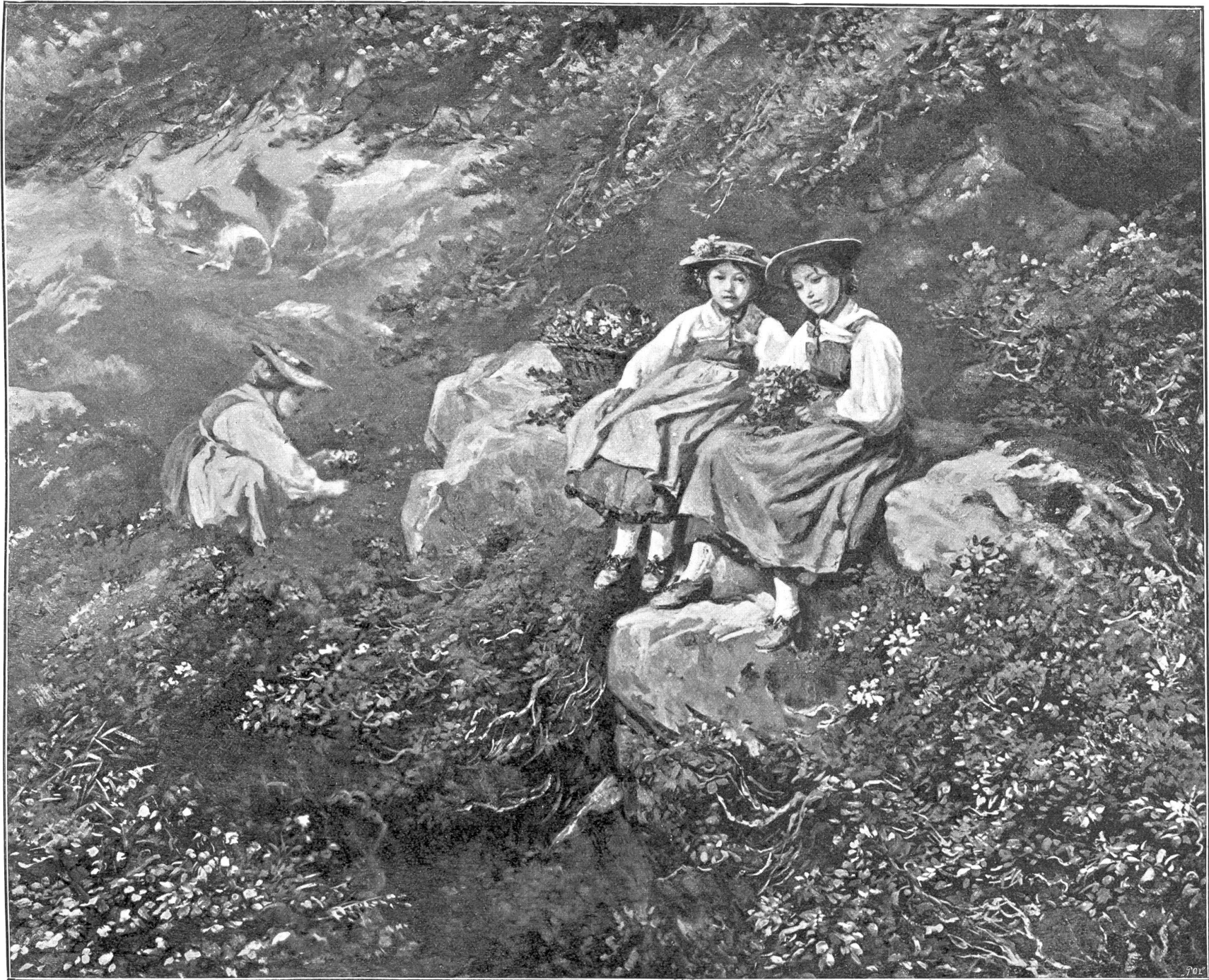
In den Alpenrosen. Gemälde von † Raphael Ris, Sitten.