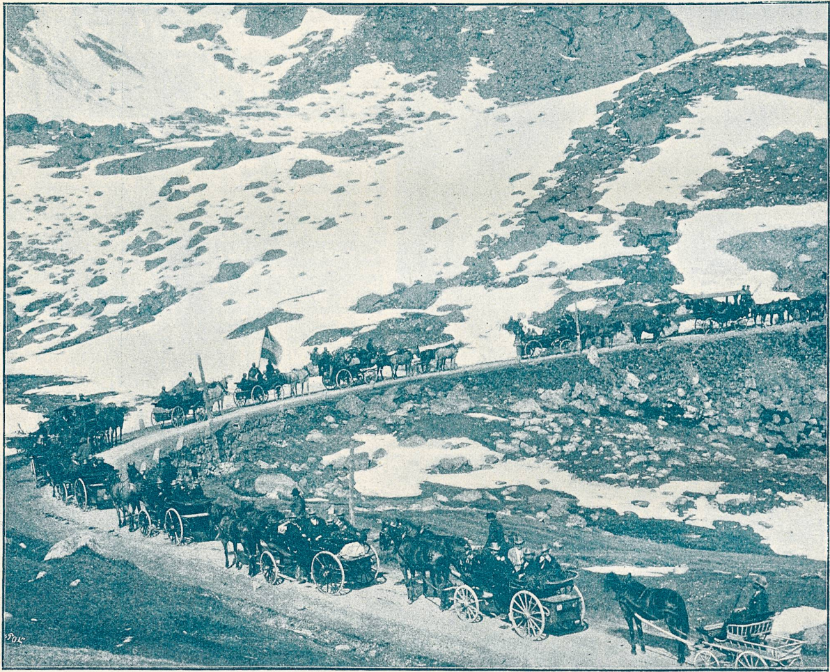
Der Männerchor Chur auf der Fahrt nach dem Sängerfest in St. Moritz.

Unser Bild stellt den Männerchor Chur dar, welcher in einer Anzahl zwei- und vierpänniger Wagen nach dem Sängerfeste in St. Moritz fährt. Ganz abgesehen davon, daß derartige Vereinsfahrten schon jetzt im Schweizerlande zu den Seltenheiten gehören, wird man auch im Bündnerlande in wenigen Jahren bei entfernteren Festanlässen per Bahnwagen durch die Täler und durch die Berge rollen.