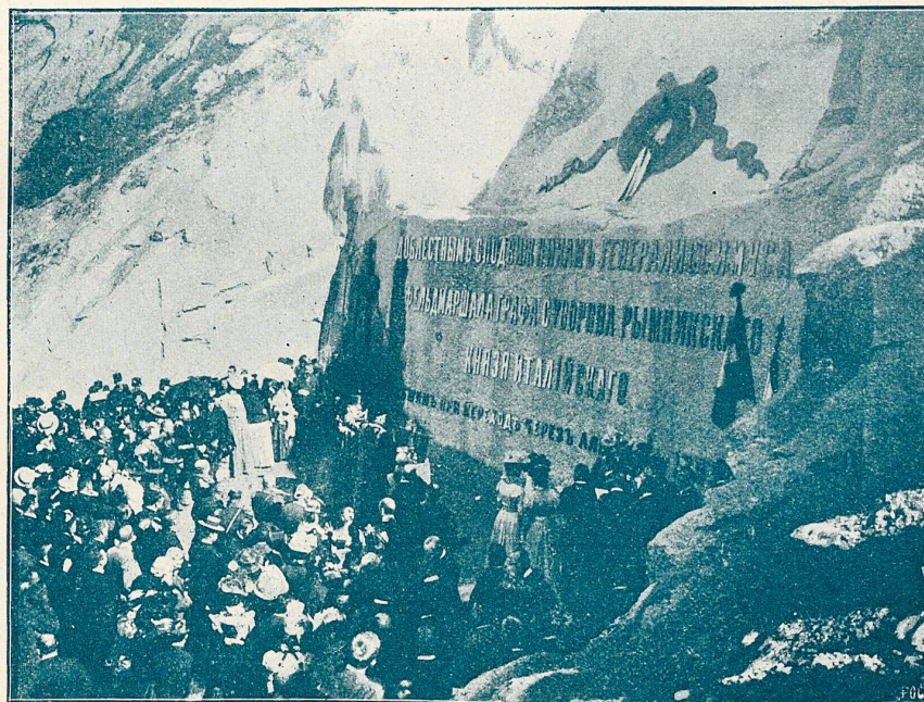
Der russische Pope erteilt den Anwesenden an der Einweihungszeremonie des Russendenkmals den Segen.

Unter den rasch aufeinanderfolgenden Ereignissen jener Zeit blieb diese wahre Heldenthat Suworows, die Bezwin-