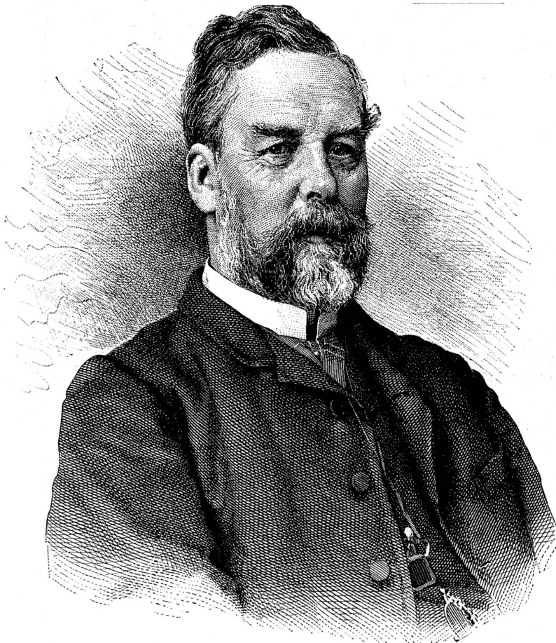
(Aus Schweiz. Porträtgalerie).

Milthätige Gaben, auch wenn sie noch so bescheiden sind, werden herzlich verdankt und in diesen Blättern quittiert werden, und die Redaktion der „Schweiz“ bittet ihre Leser, ihr solche mit dem Vermerk „für die Verunglückten von Merligen“ zur Weiterbeförderung an das „Hilfskomite Merligen“ einzusenden.