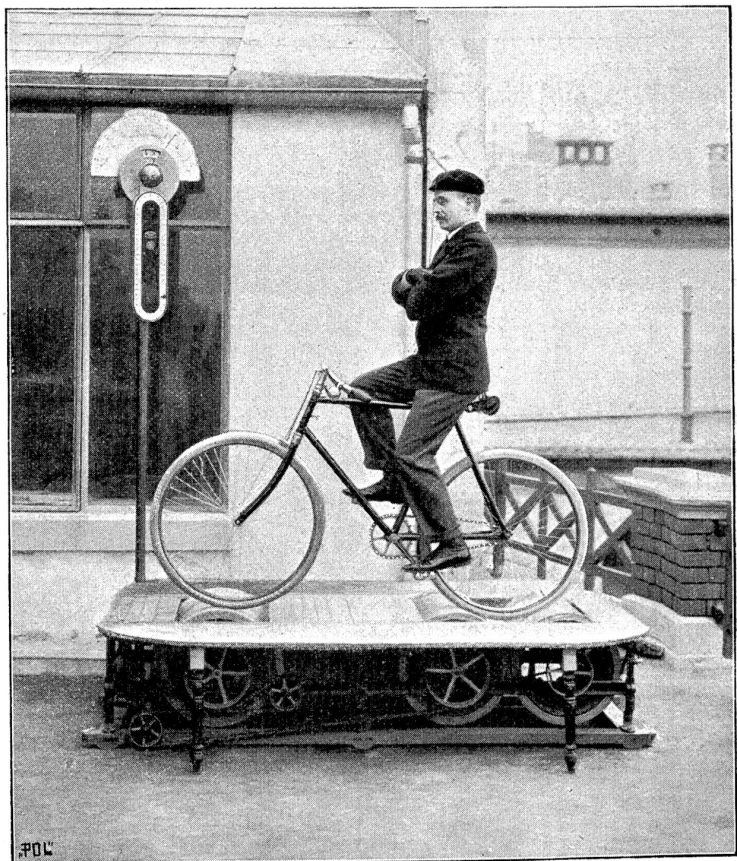
Abb. 4. Freihändiges Fahren.