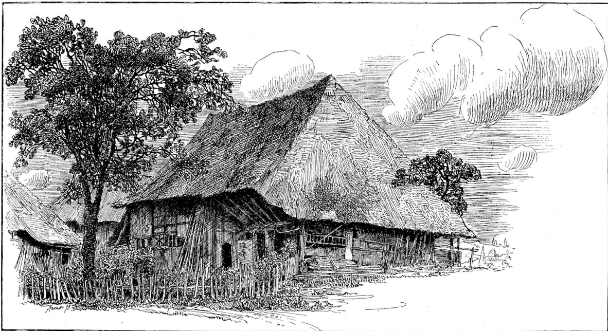
Alsgausches Bauernhaus. Originalzeichnung von Ammer, Baden.