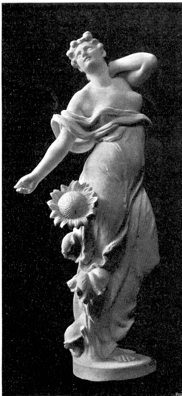
Statue von Richard Kissling, Zürich.

„Ne! sie werden es wohl glauben, wenn sie mich sehen. Da bindet mich fest und machet wir uns auf den Weg. Es ist im Gefängnis von St. Jakob.“