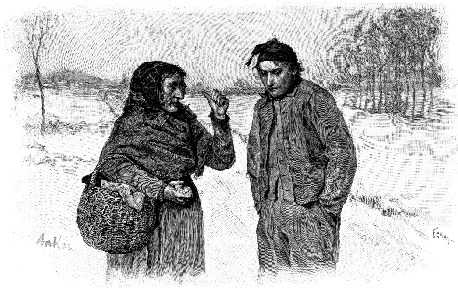
Komm' du, sagte die Vagantin zu Dursli, mit mir hintern Dorfe durch. — Original von Anker, Holzschnitt von Florian. Aus der illust. Nationalausgabe von Jeremias Gotthelfs ausgewählten Werken, II. Teil. In Vorbereitung bei der Verlagsbuchhandlung F. Zahn in La Chaux-de-Fonds.