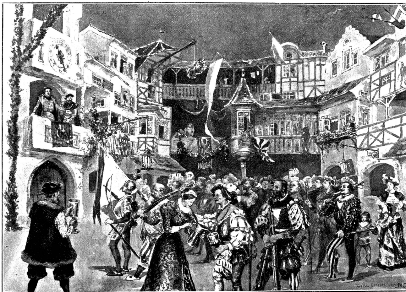
Das Gesellschafsschießen in St. Gallen von 1527: Empfang der Zürcher Schützen.