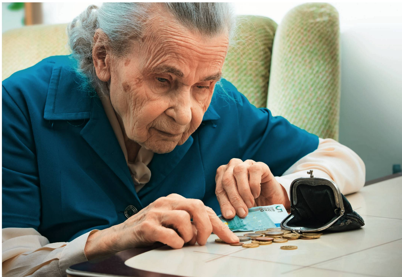
Wie viel eine betagte Person selber an die Pflegeheimkosten zahlen muss, hängt stark von ihrem Wohnort und ihrer finanziellen Situation ab.

Die beschrifteten Säulen in der Grafik 1 entsprechen den verrechneten Pflegeheimkosten. Das sind die Kosten, die Frau Meier als Rechnung vom Pflegeheim erhält. Die schwarze Linie in der