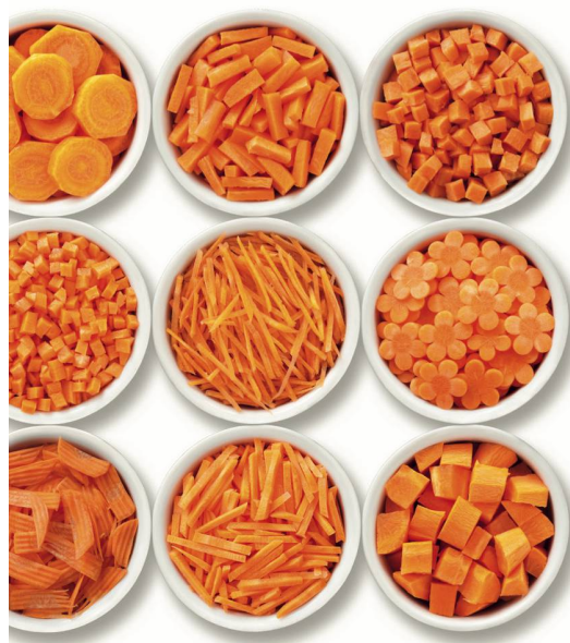
Sortimentserweiterung – von der Breite in die Tiefe