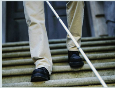
Sehbehinderung: Vielfalt von Situationen.

In der Schweiz leben gegen 380 000 Menschen mit Sehbehinderung, Blindheit, Hörsehbehinderung oder Taubblindheit – weit mehr, als bislang vermutet wurde. Zu diesem Ergebnis kommen die neuesten Berechnungen des Schweizerischen Zentralvereins für das Blindenwesen SZBLIND. Mit einem Fachheft sollen die Sehenden sensibilisiert werden und «einen Blick auf die Vielfalt der Situationen dieser Menschen werfen». Von den rund 377 000 betroffenen Personen sind etwa 50 000 blind, das heisst, sie können in den meisten täglichen Situationen kein Sehpotenzial nutzen. Der übrige, weit grösste Teil von Menschen mit Sehbehinderung nutzt – wenn es die äusseren Umstände erlauben – ein noch vorhandenes Sehvermögen. Etwa 57 000 Personen leben gleichzeitig mit einer Hörbehinderung. Damit entsteht eine Situation, die Hörsehbe-