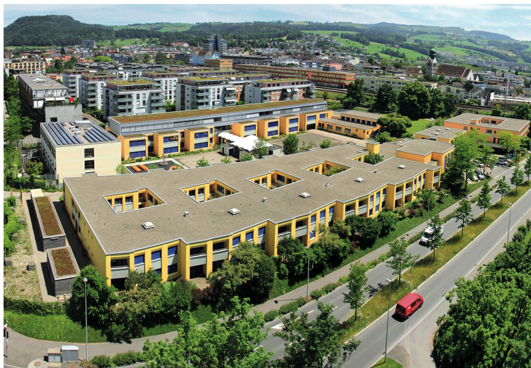
Heilpädagogisches Schul- und Beratungszentrum «Sonnenberg»

in Baar ZG: Eine den Bedürfnissen der Kinder entsprechende