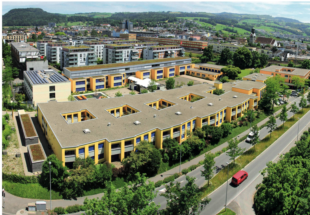
Heilpädagogisches Schul- und Beratungszentrum «Sonnenberg»