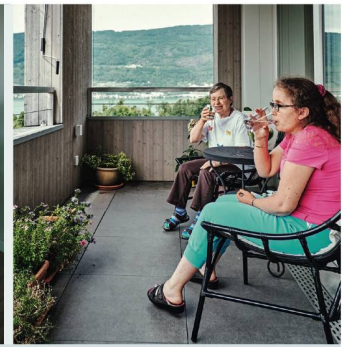
Fröhliches Bewegen, gesundes Essen in der gemütlich eingerichteten Wohnküche und vom Balkon aus den Seeblick genießen: Das alles gehört in der Stiftung Horizonte Sutz ebenfalls zur Lebensqualität.