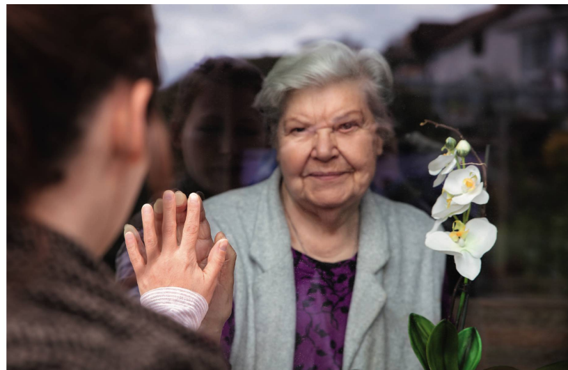
Während des Besuchsverbots in den Heimen konnten die Bewohner Glas- oder Plexiglasscheiben hindurch mit ihren Angehörigen in

Die «Swiss National Covid-19 Science Task Force», auch nationale wissenschaftliche Covid-19 Task Force genannt, fungiert als unabhängiges wissenschaftliches Beratungsgremium für die politischen Behörden. Sie wurde am 31. März 2020 via Mandat des Krisenstabs gegründet, der vom Bundesrat, vom Staatssekretariat für Bildung, Forschung und Innovation (SE-FRI) und vom Bundesamt für Gesundheit (BAG) zur Bekämpfung der Pandemie eingerichtet wurde. Die Task Force bringt wissenschaftliche Experten von Schweizer Universitäten und Forschungsinstitutionen zusammen. Ihr Engagement ist ehrenamtlich. Ihre Analysen und Empfehlungen spiegeln den aktuellen ethischen, sozialen und wirtschaftlichen Wissensstand wider und sind unabhängig von den Behörden.