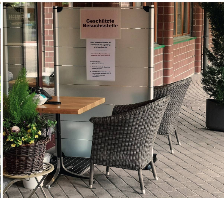
Alterszentrum Wengistein während des Corona-Lockdowns im Frühjahr:

«Pauschale Isolation und Einsperrung sind für uns aus ethischer und moralischer Sicht undenkbar.»