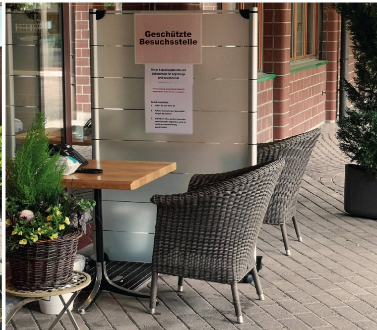
Alterszentrum Wengstein während des Corona-Lockdowns im Frühjahr:

«Pauschale Isolation und Einsperrung sind für uns aus ethischer und moralischer Sicht undenkbar.»