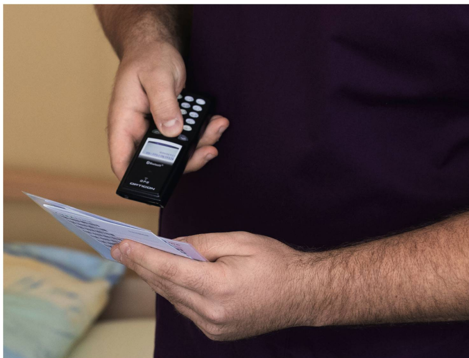
Die Curatime-Analyse: Während 14 Tagen scannen die Mitarbeitenden auf einer Liste mit Strichcodes die abgeschlossenen Tätigkeiten ab.

Zu einer Anpassung der Tarife komme es vor allem dann, unterstreicht der Experte, wenn nicht einzelne Heime, sondern die Kantone solche Tätigkeitsanalysen durchführen oder bestehende Analysen kantonsweit auswerten und mit anderen Kantonen vergleichen. Neben dem Aargau sind solche Projekte auch in anderen Kantonen durchgeführt worden. Für 2021 und 2022 ist ein grosses Projekt im Kanton Baselland geplant, wo der Kanton eine Analyse in sämtlichen Heimen durchführt. Für eine Verbesserung der Finanzierung sei zudem der Druck