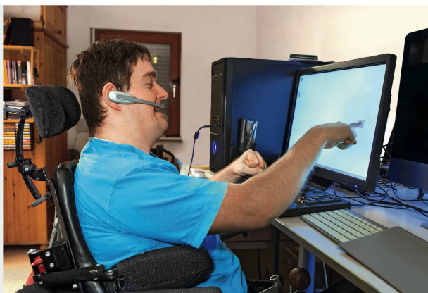
Jugendliche stehen vor der Herausforderung, ihre Angebote stetig weiterzuentwickeln. Die Forschung leistet einen wichtigen Beitrag, um die Forschung eingebunden werden. Zudem brauchen die Einrichtungen Hilfe bei der Umsetzung von Forschungserkenntnissen.