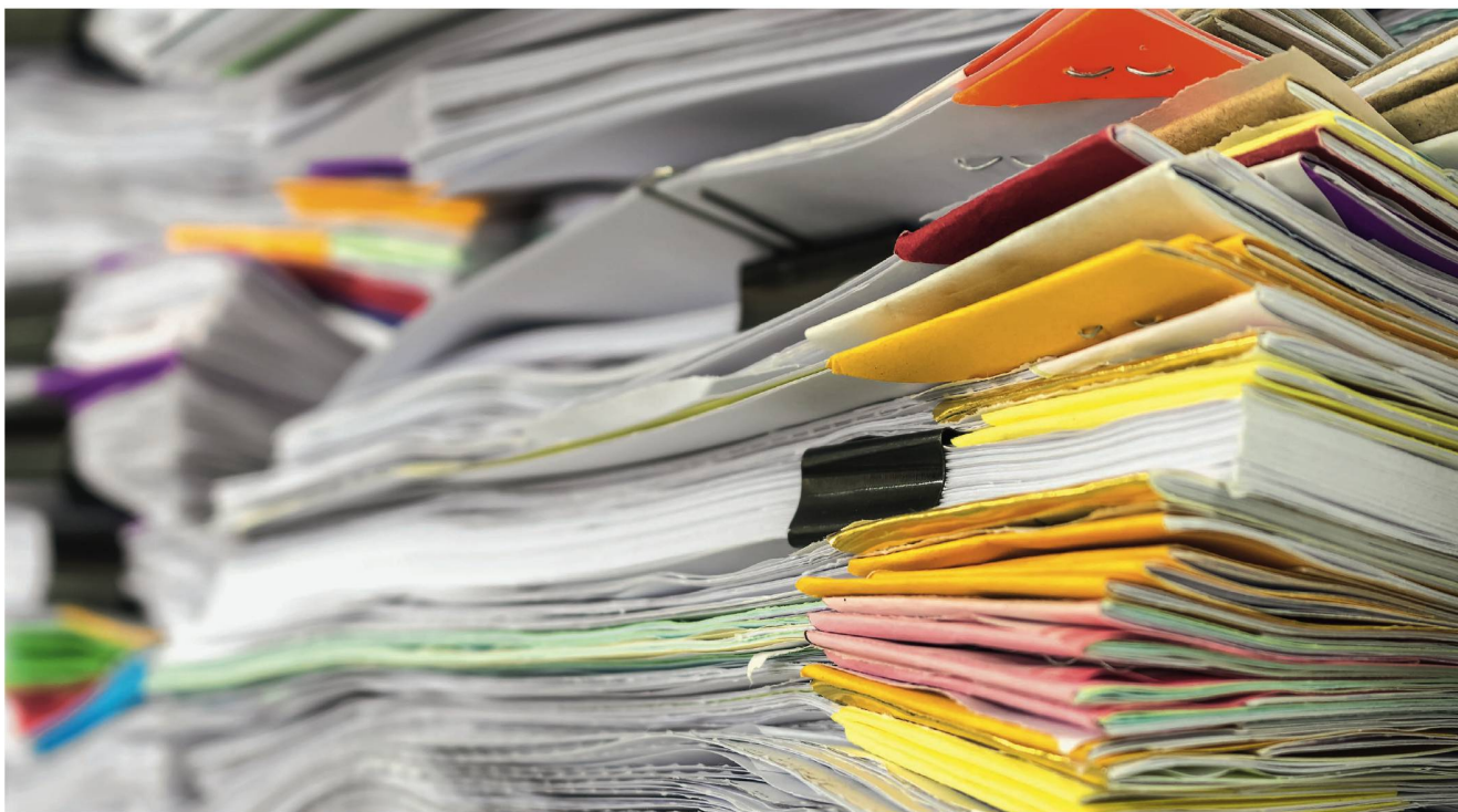
In der Forschung wird viel Papier produziert: Je mehr Publikationen Wissenschaftlerinnen und Wissenschaftler in angesehenen Wissenschaftspublikationen veröffentlichen können, desto höher ist ihre Reputation.