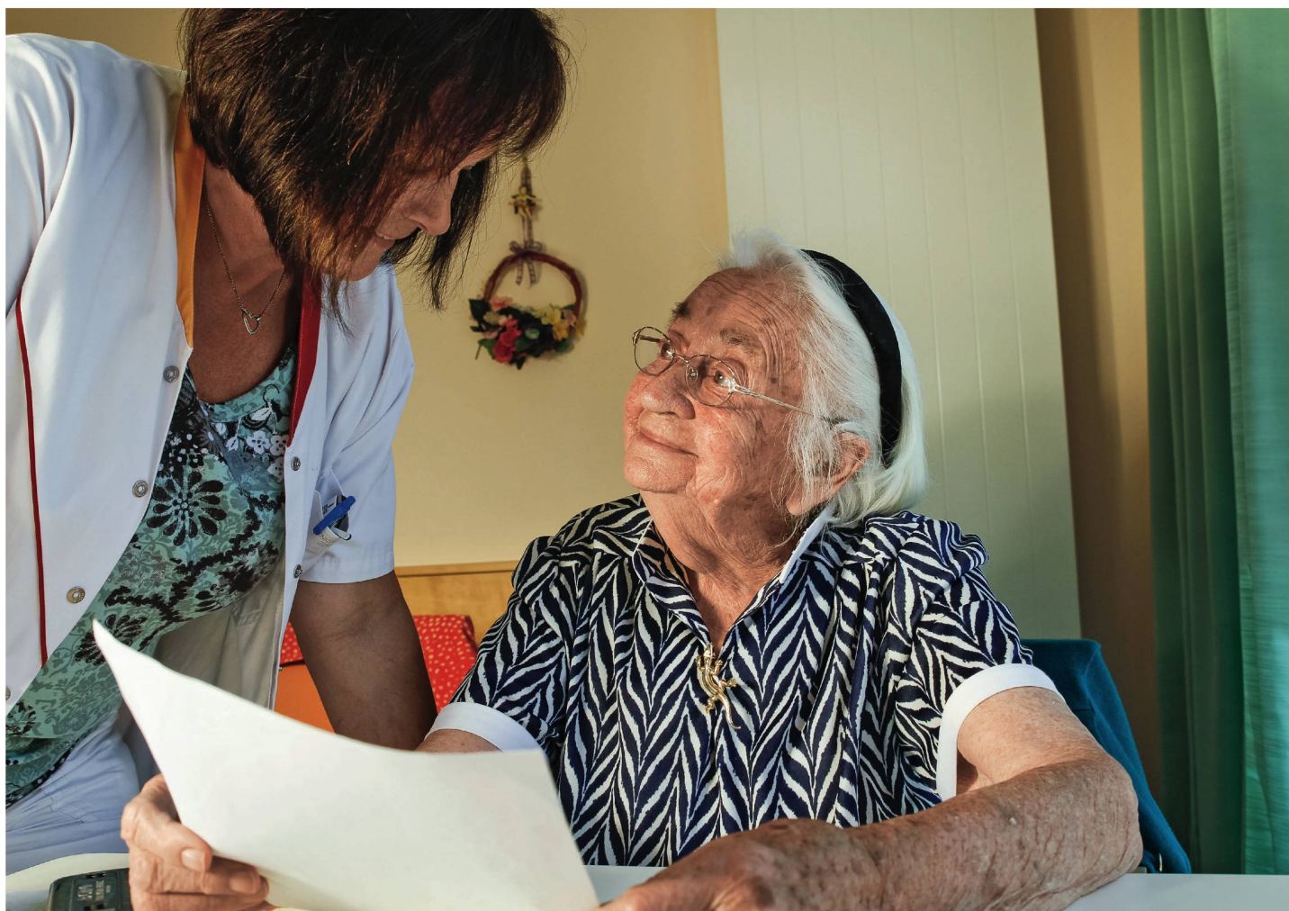
Altersbetreuung: Eine Volksinitiative verlangt, dass alte und bedürftige Menschen in «einer ihrer individuellen Situation angemessenen Weise betreut, gepflegt und in der Alltagsbewältigung unterstützt werden».