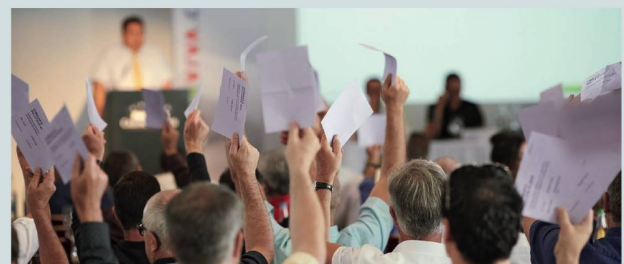
Die Delegiertenversammlung genehmigt alle Anträge des Vorstands.

Die Delegiertenversammlung fällte den Grundsatzentscheid, die Zusammenarbeit mit Insos Schweiz mit der Schaffung einer Föderation auf ein neues Fundament zu stellen und die Kräfte im Interesse der Mitglieder zu bündeln (Details zur Föderation und zu den nächsten Schritten auf S. 45).