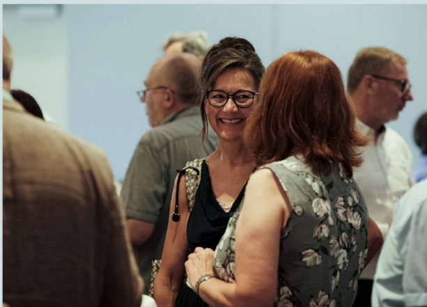
Gute Stimmung beim Begrüssungskaffee.