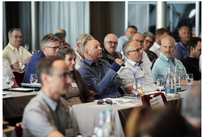
Engagierte Wortmeldungen der Delegierten.

Curaviva Schweiz blickt auf ein weiteres gesundes Finanzjahr zurück. Dass der Branchenverband 2018 statt einer ausgeglichenen Rechnung einen Gewinn von 9000 Franken erzielen konnte, ist nicht selbstverständlich. Dieser erfreuliche Abschluss ist einerseits auf den sorgfältigen Umgang mit den Mitgliederbeiträgen, Subventionen und Mitteln aus Leistungsverträgen zurückzuführen. Andererseits trugen die Einkünfte aus den Bildungs- und Dienstleistungsangeboten wesentlich zu diesem guten Ergebnis bei. Seit einem Jahr darf ich Curaviva Schweiz als Präsident vorstehen. Ich blicke mit grosser Freude und Genugtuung auf dieses erste Jahr zurück und danke herzlich für die gute Zusammenarbeit und das mir entgegengebrachte Vertrauen. Veränderungen brauchen viel Energie. Sobald Change-Prozesse erste Resultate zeigen, setzen sie aber auch neue Energien frei. Im Namen des Vorstands spreche ich allen ein grosses Dankeschön aus, die sich für Menschen mit Unterstützungsbedarf engagieren und zum Vorwärtskommen des Verbands und seiner Mitglieder beitragen. Ich freue mich auf die Fortsetzung unserer gemeinsamen Arbeit! ●