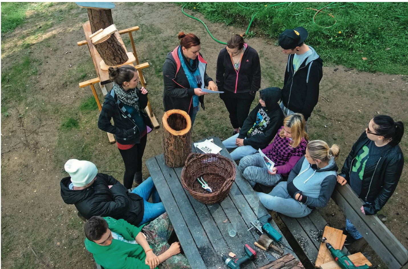
Die Sozialpädagogin und die Jugendlichen: Manchmal verstehen sie sich ausgezeichnet. Und manchmal scheint es, als würden sie jeweils eine andere Sprache sprechen und könnten einander einfach nicht verstehen.