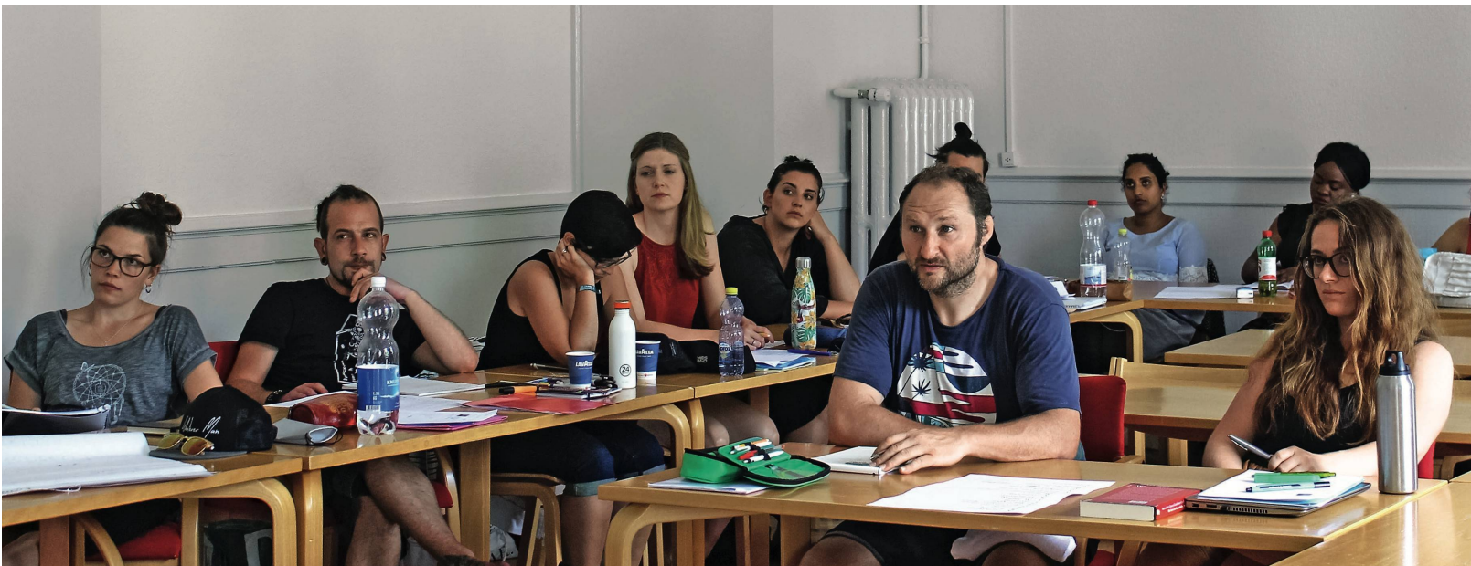
Studentinnen und Studenten der Höheren Fachschule für Sozialpädagogik Luzern: Während der Ausbildung in Schule und Praxis lernen sie damit sie für den Berufsalltag gut gerüstet sind.

berufliche Grundkompetenzen und bilden ihre Persönlichkeit,