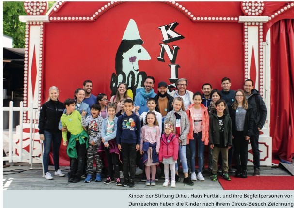
Kinder der Stiftung Dihei, Haus Furttal, und ihre Begleitpersonen vor dem Eingang des Circus Knie am Standort in Zürich. Als Dankeschön haben die Kinder nach ihrem Circus-Besuch Zeichnungen angefertigt.

Der Kontakt mit den Pferden fördert Kinder körperlich, geistig, sozial und emotional.