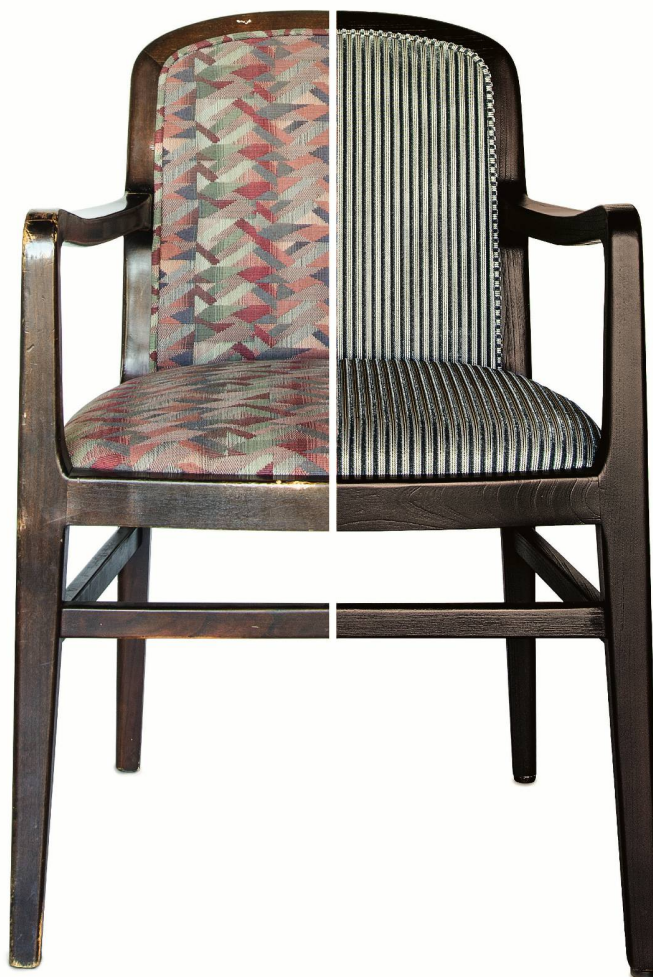
Remanufacturing vorher - nachher