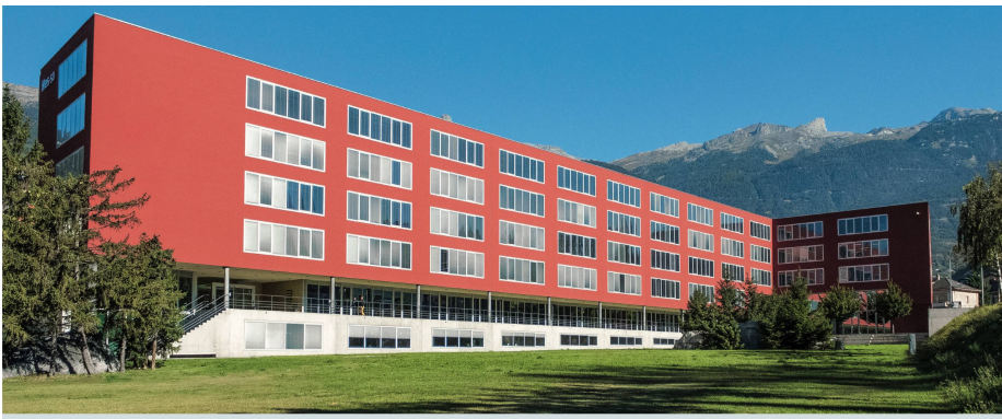
HES-SO Campus Sierre: Die Fachhochschulen Gesundheit der Romandie wollen gemäss Positionspapier die FH-Studiengänge «als einzigen Weg zum Pflege Diplom in der Westschweiz» beibehalten.