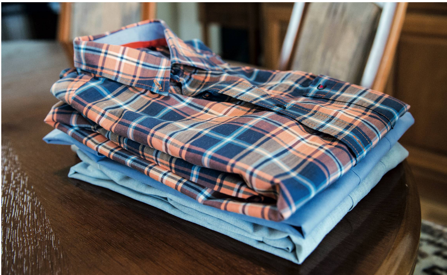
Gebügelte Hemden: Dienstleistungen nach Bedarf.