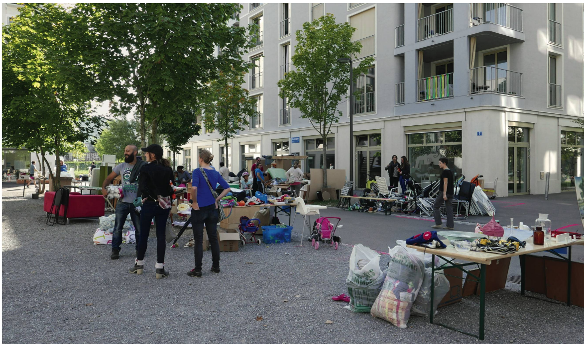
Flohmarkt auf dem Hunziker-Areal in Zürich-Leutschenbach: «Grosszügig Begegnungsräume geschaffen.»

Auch Architekten und Planer lernen von der Geschichte. Wir lesen die Geschichte und untersuchen: Warum funktioniert etwas, und wie ist das in der heutigen Zeit zu interpretieren und umzusetzen?