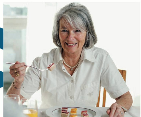
Küchenfertige Produkte Convenience Lösungen