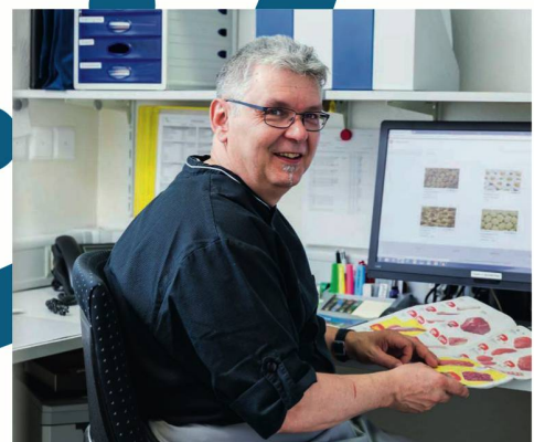
Alles aus einer Hand

Transgourmet Schweiz AG Lochackerweg 5 3302 Moosseedorf Kundencenter: 0848 000 501 www.transgourmet.ch/care