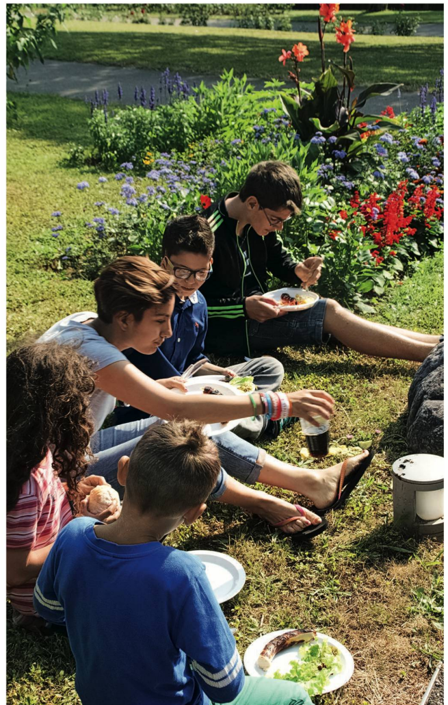
Geselliges Miteinander im Garten des Schul- und Förderzentrums Wenkenstrasse in Riehen.

Als Vorzeigekanton gilt schweizweit der Kanton Basel-Stadt. Über die Bestimmungen im Sonderpädagogikkonkordat hinaus ist hier seit 2011 im Gesetz verankert, dass Kinder und Jugendliche mit einer Behinderung vorzugsweise integrativ geschult werden sollen. Und zwar auch Kinder mit einem sehr umfassenden Unterstützungsbedarf: Dazu zählen Schülerinnen und Schüler mit schweren körperlichen Behinderungen, einschliesslich Hör- und Sehbehinderungen, zudem Kinder mit geistigen Behinderungen. Die Lehrpersonen der Regelklassen