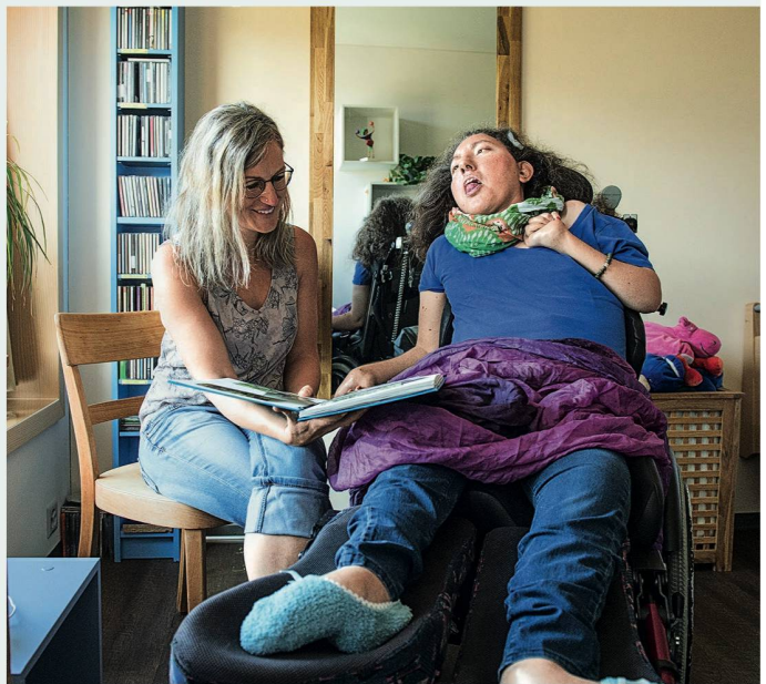
Zeigen, dass man eine Tasse Milchkaffee möchte, sich beim Baden austoben, auf der Terrasse Sonne und Luft spüren oder gemeinsam das Ferientagebuch anschauen: Das Team der Wohngruppe Topaz schafft überall kleine Freiheiten.

rigen, vom Elternhaus, von allfälligen Haustieren, aber auch von Lieblingsorten, liebsten Beschäftigungen und Leibspeisen. Die Ich-Bücher geben den Bewohnerinnen und Bewohnern jenes Stück Identität, das sie aufgrund fehlender verbaler Kommunikation im Gespräch nicht zeigen können, sie geben auch Besuchern die Gelegenheit, die Person kennenzulernen.