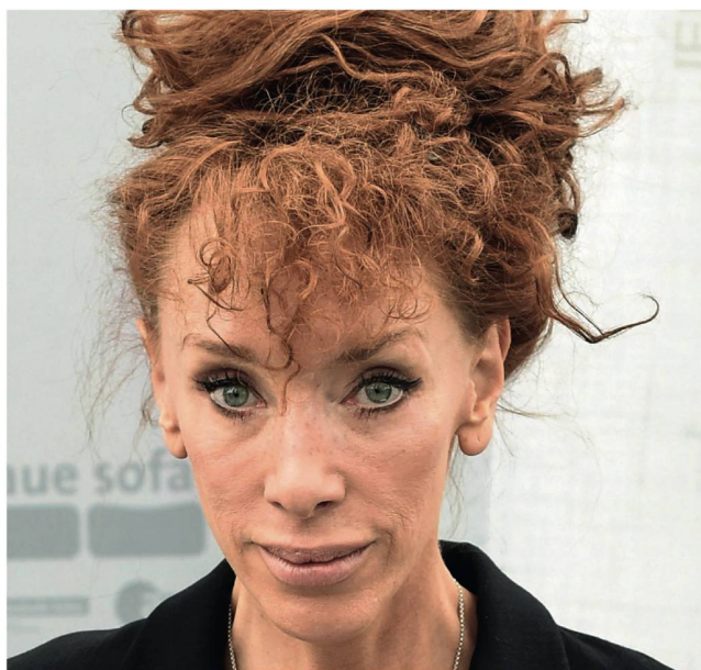
Schriftstellerin Sibylle Berg: Referendum via Social Media.

Es dürfte ein emotionaler Abstimmungskampf werden. Niemand bestreitet zwar, dass es immer wieder Menschen gibt, die namentlich die Invalidenversicherung (IV) hinters Licht zu