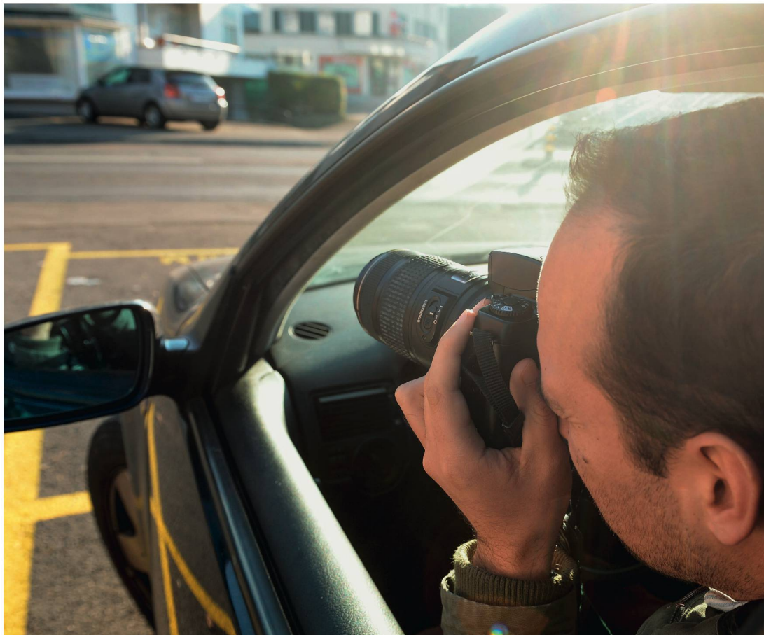
Überwachung von verdächtigen Sozialversicherungsbezüglern: Mehr Kompetenzen als die Strafverfolgungsbehörden?