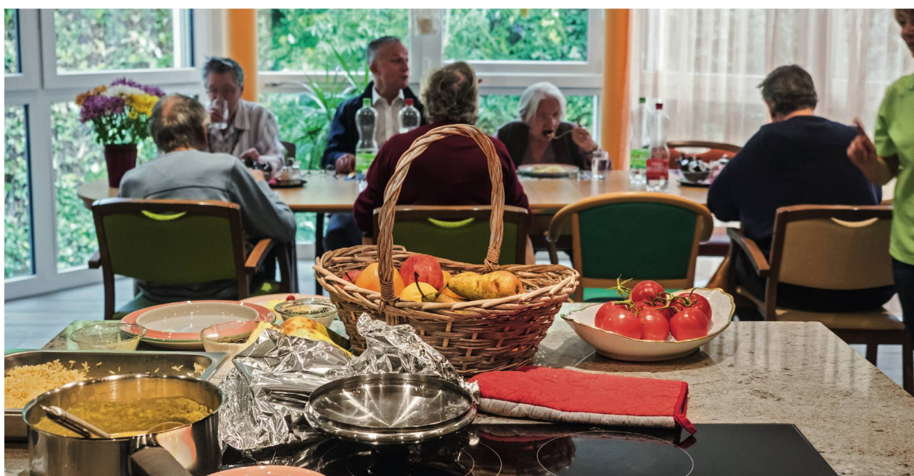
Mittagszeit in einer Pflegewohngruppe von Almacasa ZH: Wer Lust und die nötige Kraft hat, hilft bei der Zubereitung der Mahlzeiten. Eine familiäre Atmosphäre und die gegenseitige Fürsorge prägen den Alltag.