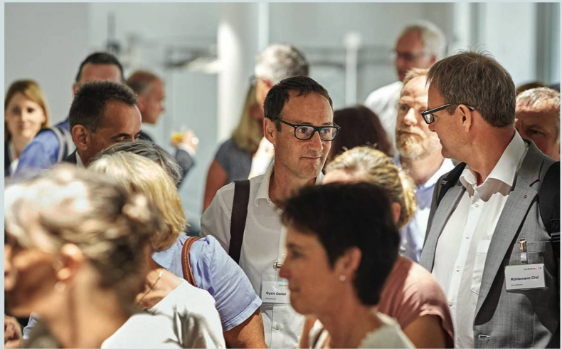
Andrang im Foyer am frühen Nachmittag, beim Eintreffen der Delegierten aus der ganzen Schweiz.