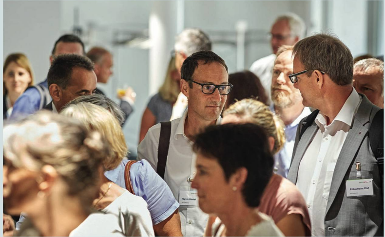
Andrang im Foyer am frühen Nachmittag, beim Eintreffen der Delegierten aus der ganzen Schweiz.