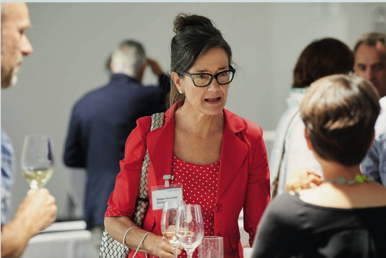
Bei einem Glas Weisswein lässt es sich noch besser fachsimpeln.