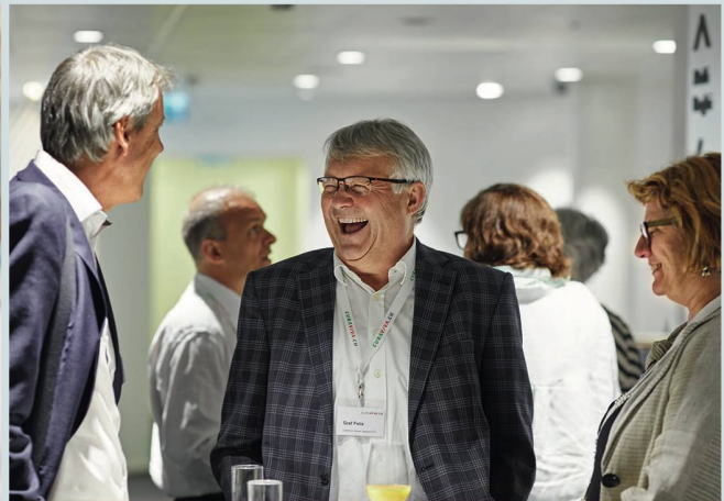
Ein wichtiges Element der Delegiertenversammlung: der Gedankenaustausch unter Berufskollegen und Berufskolleginnen.