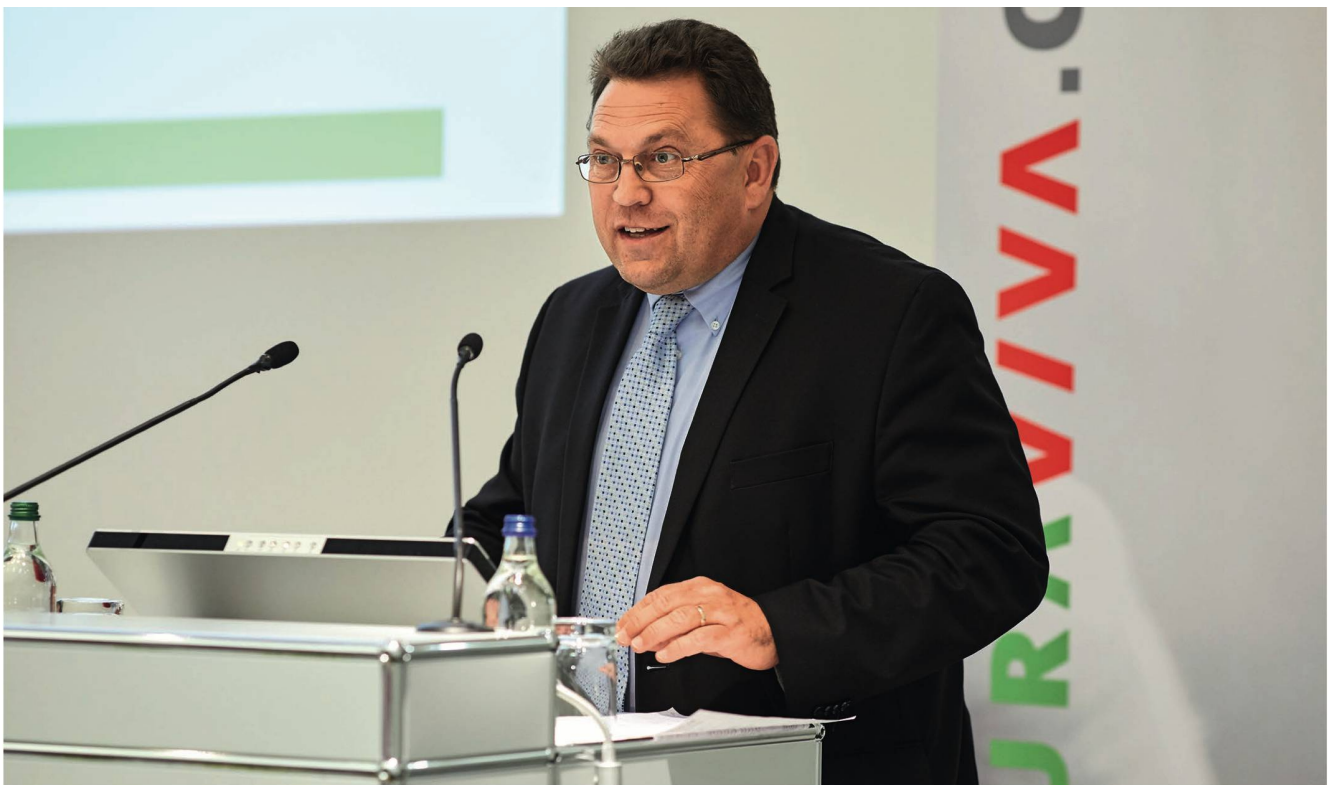
Laurent Wehrli, der frisch gewählte Präsident von Curaviva Schweiz, stellt sich den Delegierten vor. 1965 in Montreux geboren, ist er heute Stadtpräsident von Montreux und seit 2015 Nationalrat (FDP). Seit vielen Jahren beschäftigt er sich mit sozial- und gesundheitspolitischen Themen. Er ist verheiratet und Vater von fünf Kindern.