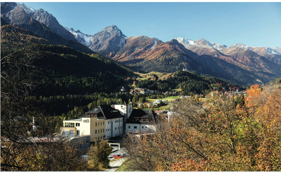
Pflegeheim und Spital befinden sich im gleichen Gebäude in Scuol. Das vereinfacht die Wege, die sonst im weitläufigen Unterengadin sehr lang sein können.