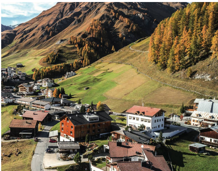
ben können, befindet sich ein Seniorencenter mit integrierter Samnaun.