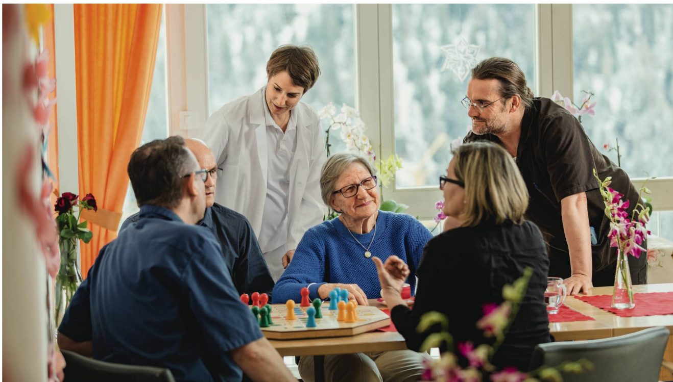
Beratungsgespräch mit Pflege, Arzt, Bewohner und Angehörigen im Pflegeheim Chūra Lischana. Einen Überblick über alle Angebote des Gesundheitszentrum hat die Familie schon bei der Beratungsstelle erhalten.