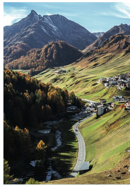
Damit die Menschen in ihrem Dorf bleiben, werden Pflegegruppe und Alterswohnungen in

Das bedeutet, dass Patienten bei Übertritten standardisiert mit den gleichen Dienstleistungen und Produkten weiter behandelt werden. Dadurch kommt es zu weniger Missverständnissen, und die Versorgungsqualität kann gewährleistet werden.