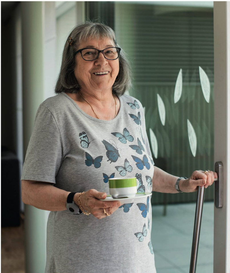
Schwellenloser Ausgang auf die Terrasse, sichtbares Glas, verlängerte Türfalle: Sturzprävention beginnt beim Bauen.