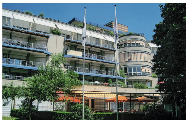
Rückansicht des Alters- und Pflegeheims Johanniter Basel mit Blick zum St. Johannspark

«Alle verfügen über grosse Handlungskompetenz. Im ganzen Haus ist es entspannter.»