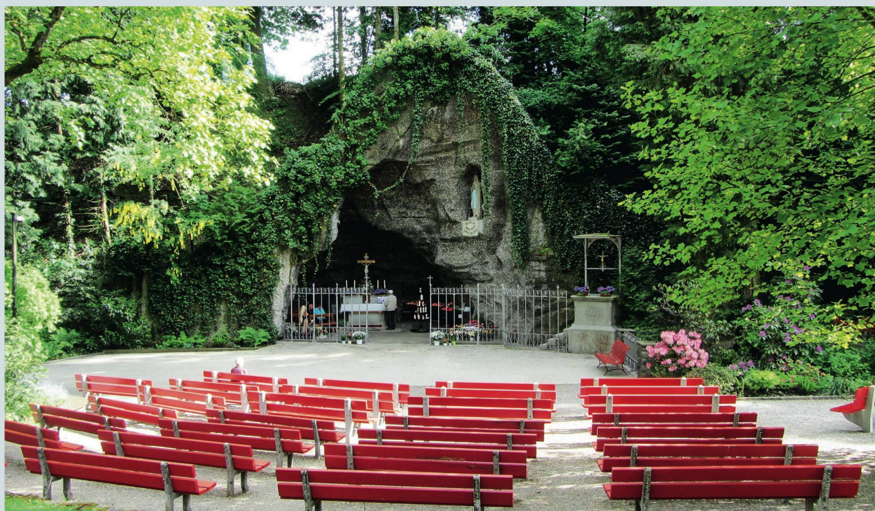
Lourdes-Grotte in Leuggern AG: Kopie aus Spritzbeton.