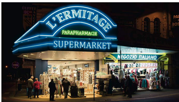
Supermarkt mit Devotionalien: Rummelplatz der Frömmigkeit.