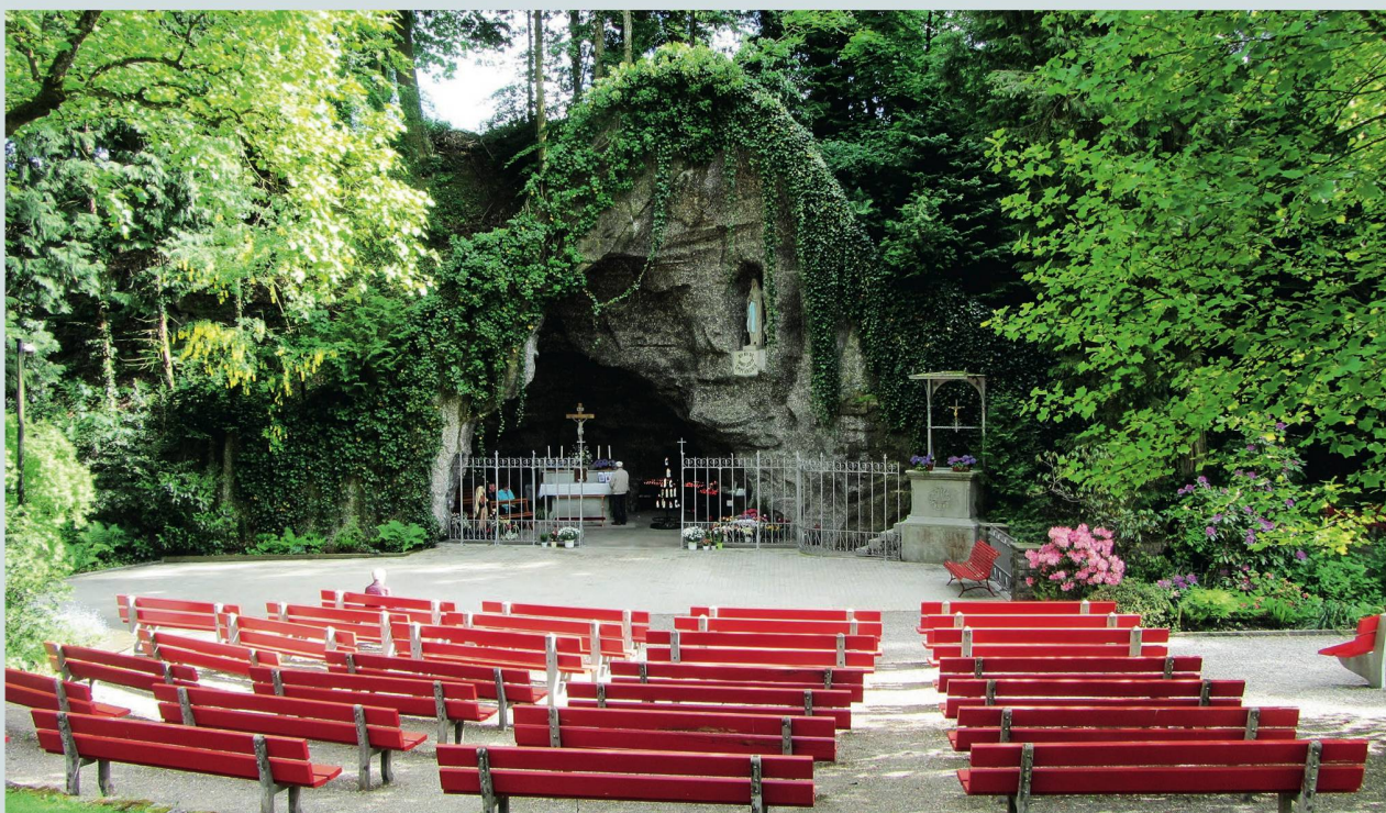
Lourdes-Grotte in Leuggern AG: Kopie aus Spritzbeton.