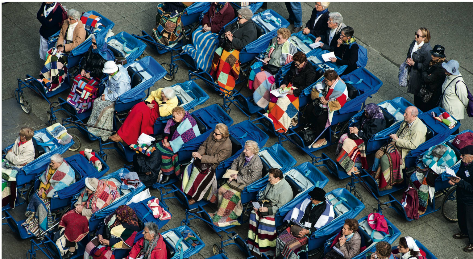
Lourdes-Pilger in den charakteristischen blauen Rollstühlen beim