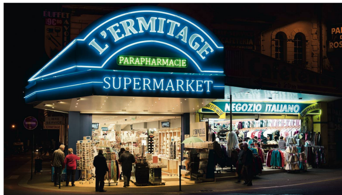
Supermarkt mit Devotionalien: Rummelplatz der Frömmigkeit.

todgeweihte fahle Gesichter, vom Krebs ausgezehrt Körper. «Was in Lourdes geschieht, berührt die meisten Menschen, auch die kritischen Geister. In Lourdes steht der kranke Mensch im Zentrum. Hier muss sich niemand verstecken, und das macht Eindruck», sagt Schönenberger.