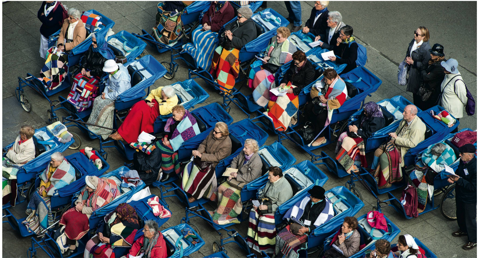
Lourdes-Pilger in den charakteristischen blauen Rollstühlen beim