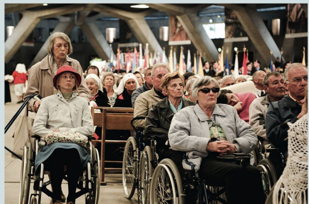
Szene aus dem Film «Lourdes»: Mit feinem Humor.

Das alles hat die Regisseurin subtil, mit Sinn für feinen Humor und mit ganz tollen Darstellerinnen und Darstellern in Szene gesetzt. Lourdes, das zeigt der Film, ist zwar ein besonderer Ort, ein Ort der Hoffnung, des Glaubens und der Gemeinschaft unterschiedlichster Menschen aus unterschiedlichsten Weltgegenden. Aber eben: Es sind Menschen. Auch wenn die fromme Miene, die gefalteten Hände und der zuweilen verklärte Blick in Lourdes quasi zur obligaten Gestik und Mimik gehören, so können die meisten doch nie ganz verbergen, dass auch weniger gottgefällige Regungen und Gedan-