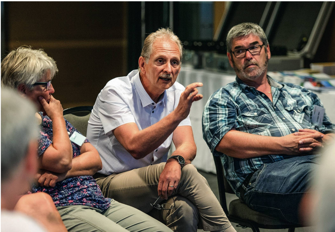
Über 60 Verbandsvertreter nehmen an den Leitbild-Workshops teil und leisten damit einen wichtigen Beitrag an die Zukunft von Curaviva Schweiz.

Workshops behandelten die Teilnehmer unter anderem folgende Fragestellungen: