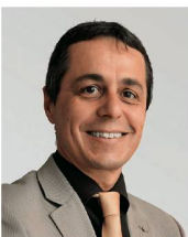
* Dr. Ignazio Cassis, Präsident Curaviva Schweiz

Der Vorstand von Curaviva Schweiz ist überzeugt: Ein Leitbild muss breit abgestützt sein, damit es «leben» und etwas bewirken kann. Die gemeinsame Arbeit am Leitbild ist dafür Voraussetzung. «Gemeinsam die Zukunft gestalten» war dann auch das Motto der Leitbild-Workshops vom 20. Juni 2017. In den