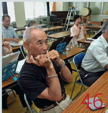
Alt werden in Japan