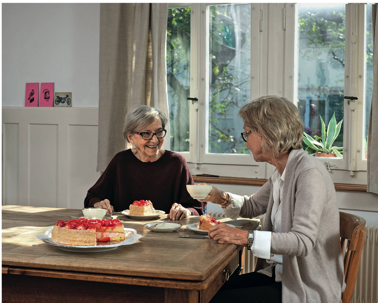
«Care-Arbeit» ist mehr als medizinische Pflege – etwa auch Begleitung im Alltag.