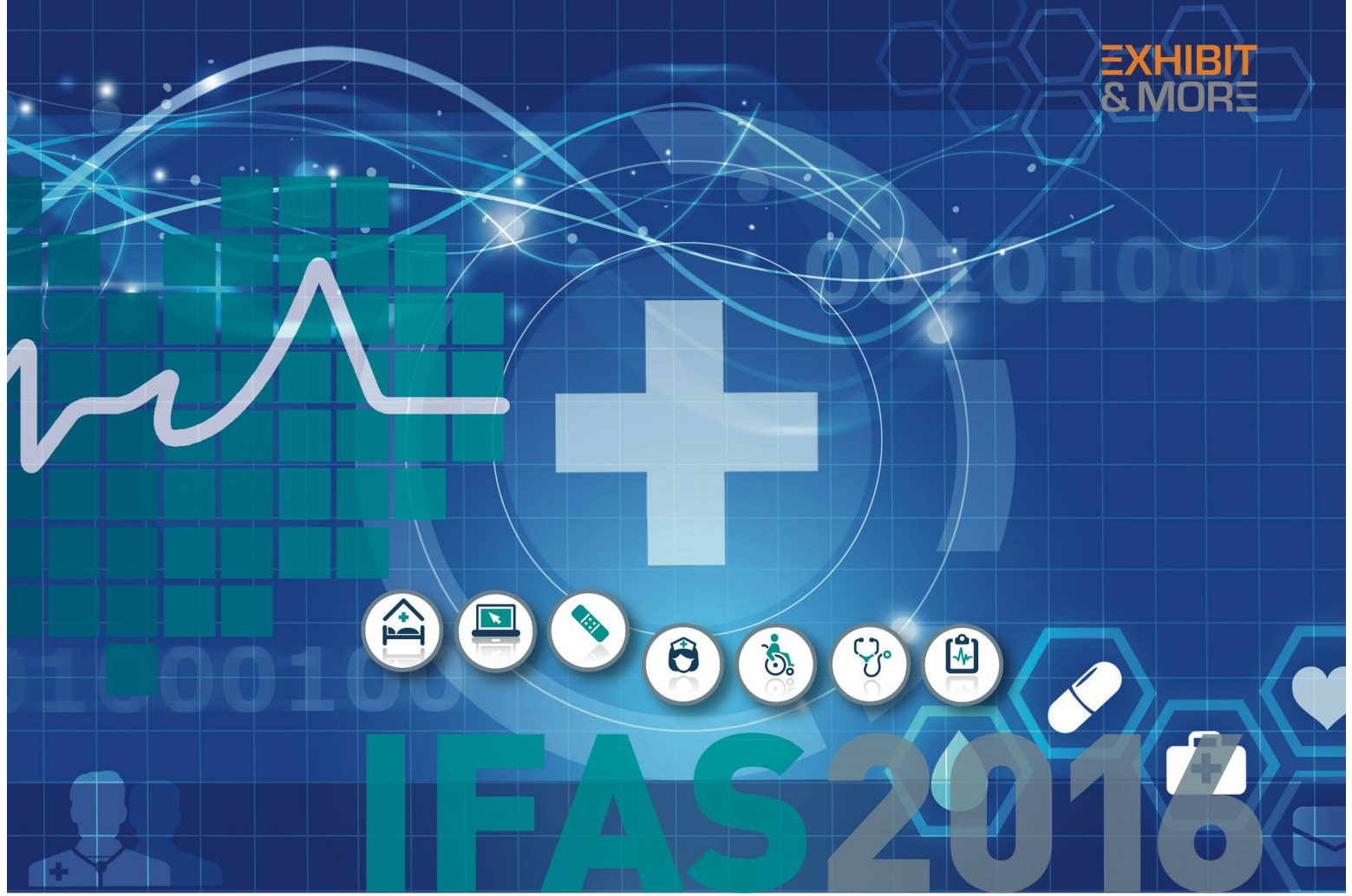
EXHIBIT & MORE