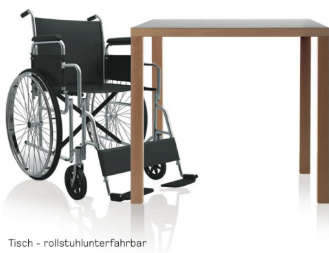
Tisch - rollstuhlunterfahrbar

Wir bieten Speziallösungen mit durchdachten Konstruktionen und hilfreichen Details.