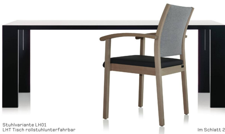
Stuhlvariante LH01 LHT Tisch rollstuhlunterfahrbar

Im Schlatt 28 | A-6973 Höchst | +43 5578 75292 | office@stuhl.at | www.stuhl.at