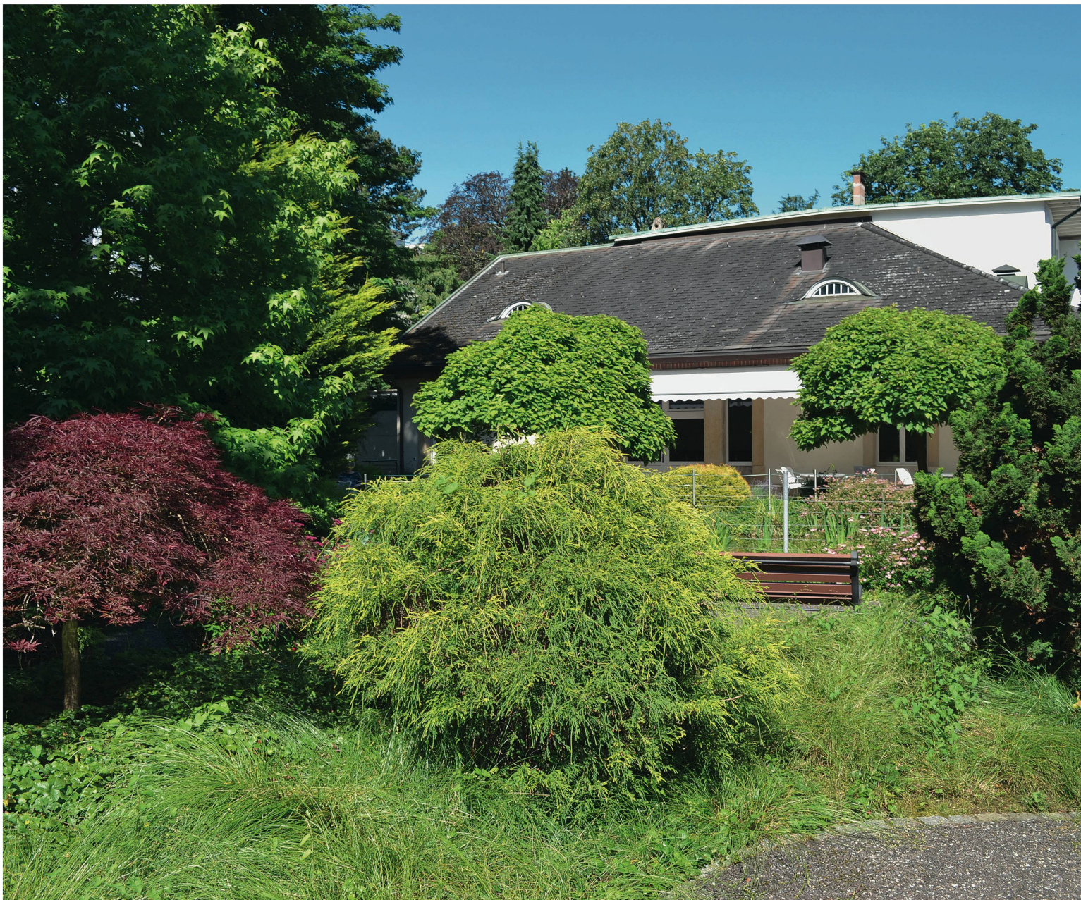
Beispiel für einen friedlichen Demenzgarten, der zum Flanieren unter den Büschen und hohen alten Bäumen einlädt: Der abgetrennte Garten im Altersheim Adullam in Basel. Hier drohen keine giftigen oder gefährlichen Pflanzen, und der Weg führt immer wieder zum Ausgangspunkt zurück.