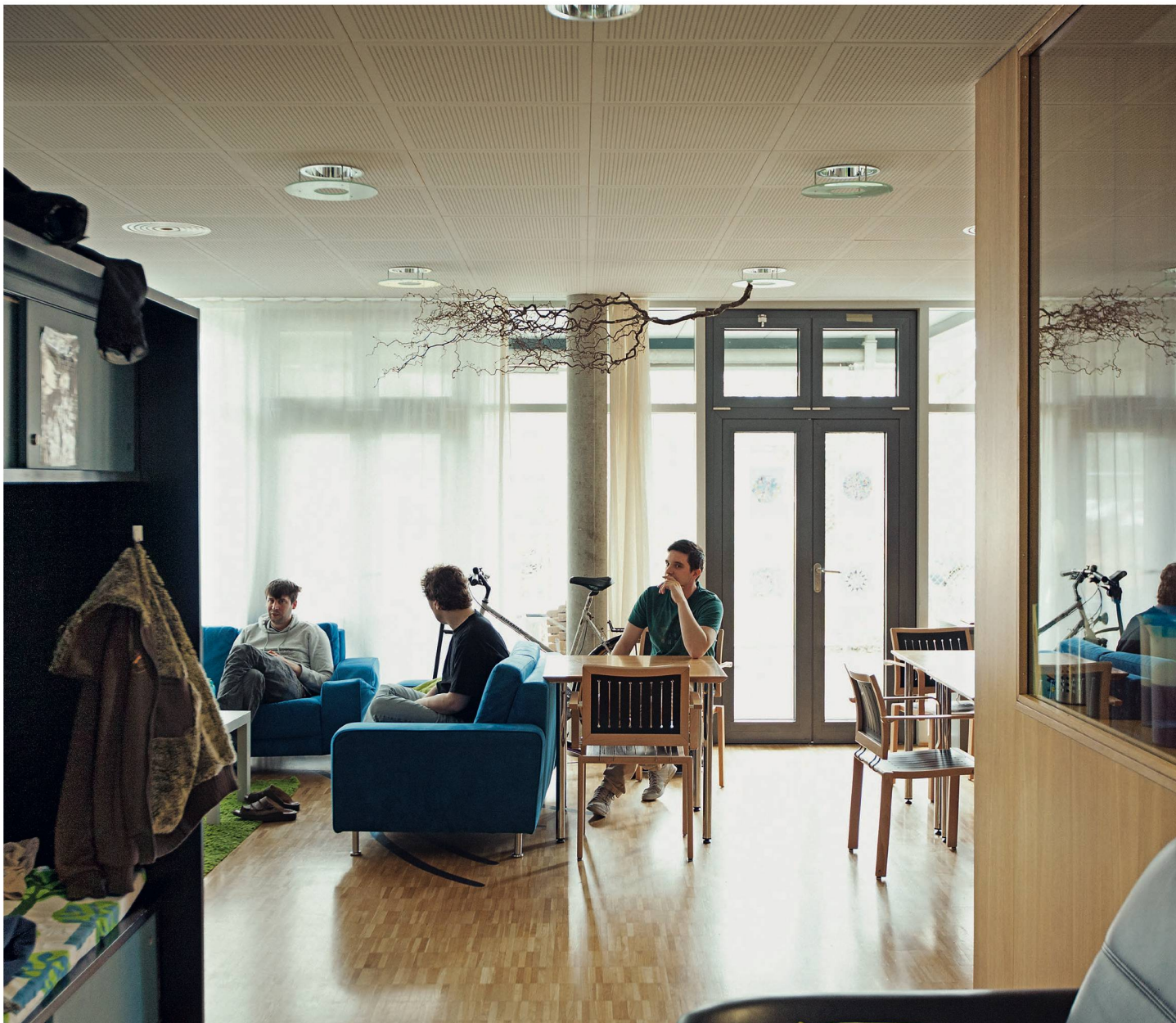
Eine nicht ganz gewöhnliche WG: Der gemeinsame Wohn- und Essbereich.

Essen, in anderen Wohnheimen hat er zwanghaft an Pfannen und Töpfen gerochen. Im Essraum steht ein kleiner Holztisch einsam abseits. Die einzige weibliche Bewohnerin, Karin*, wird schnell hibbelig, wenn sie am gleichen Tisch mit den anderen essen muss.