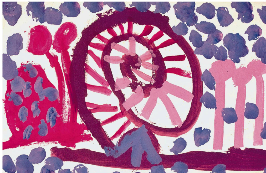
Aus dem Kritzelknäuel entwickelt sich die Spirale: Eine Richtung wird entdeckt, Absicht wird möglich.

ben grosse Bilder gemalt. Manchmal standen sie sogar auf in ihren Rollstühlen, um den oberen Rand des Bildes zu erreichen. Andere lagen bäuchlings auf Liegebrettern, hatten eine Farbpalette neben sich und zeigten mir, welche Farbe sie möchten, und ich gab ihnen den Pinsel mit der gewünschten Farbe – so malten sie wie die Könige.