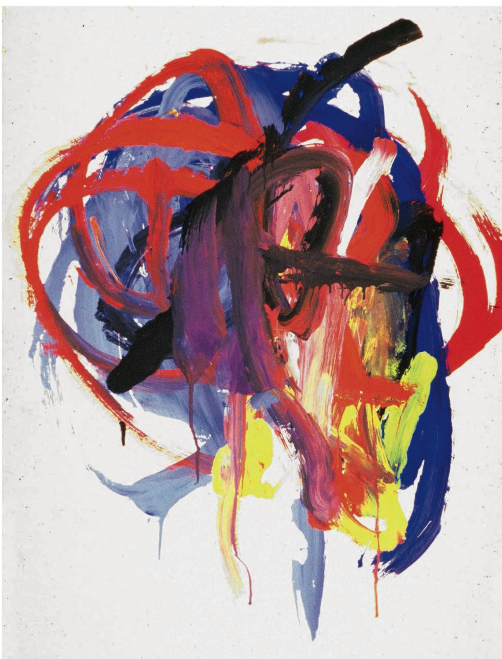
Die ersten Körperbilder werden rein motorisch kreisend gesteuert. Es entstehen Kritzelknäuel.