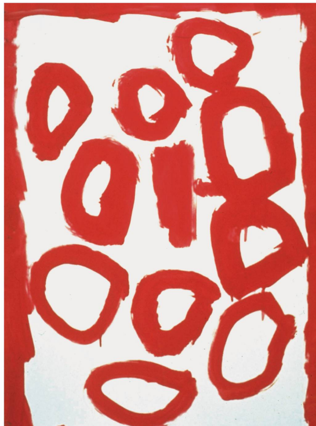
Irgendwann trifft die Richtung auf ihren Anfang, die Form wird geschlossen.