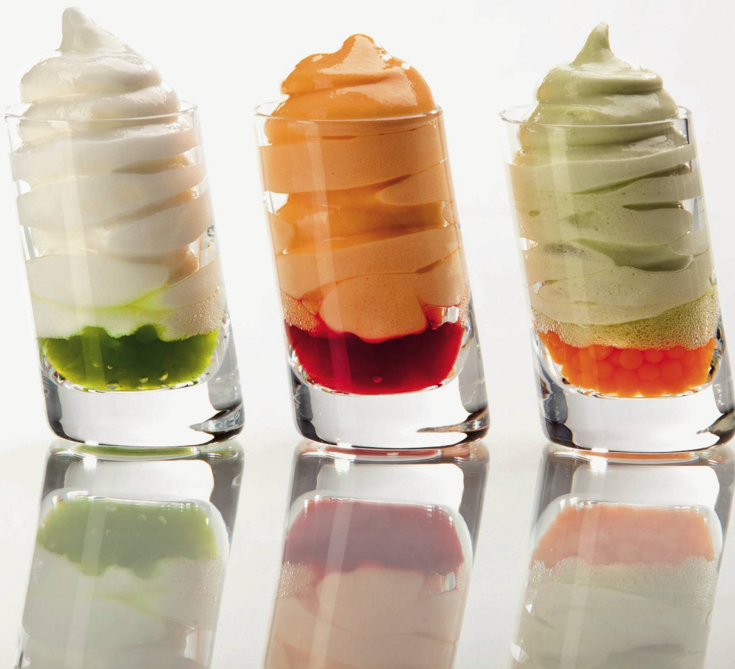
Passierte Kost: Sellerie-, Rüebli- und Broccolisalat.